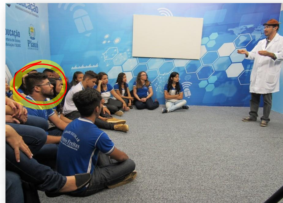
VISITA DE ALUNOS DO PÓLO DE HUGO NAPOLEÃO (U.E. ANTÔNIO FREITAS)