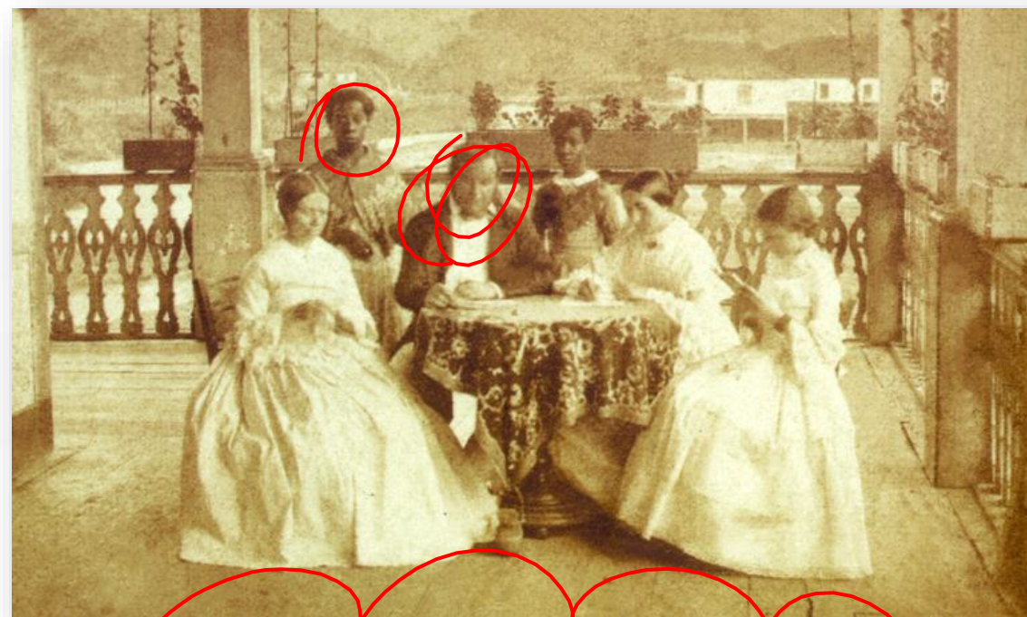
SOCIEDADE ESTRATIFICADA RICOS x POBRES