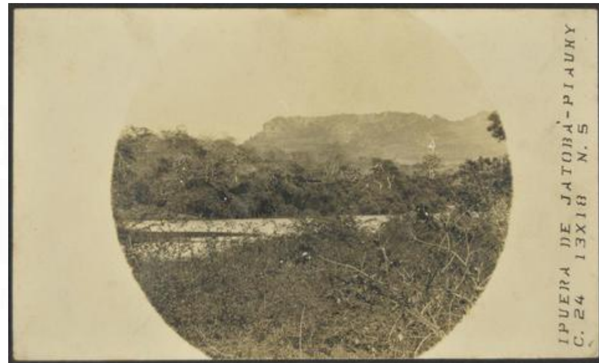
Serras do Piauí. 1912.