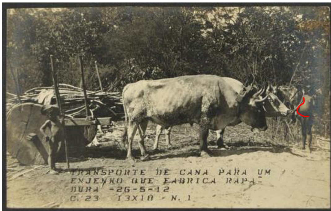
Transporte de cana para um engenho que fabrica rapadura. Caracol (PI), 1912.