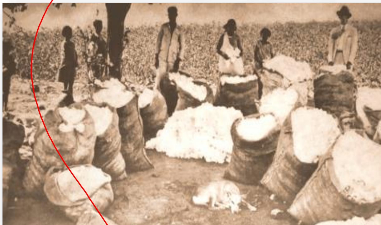
COLHEITA DO ALGODÃO