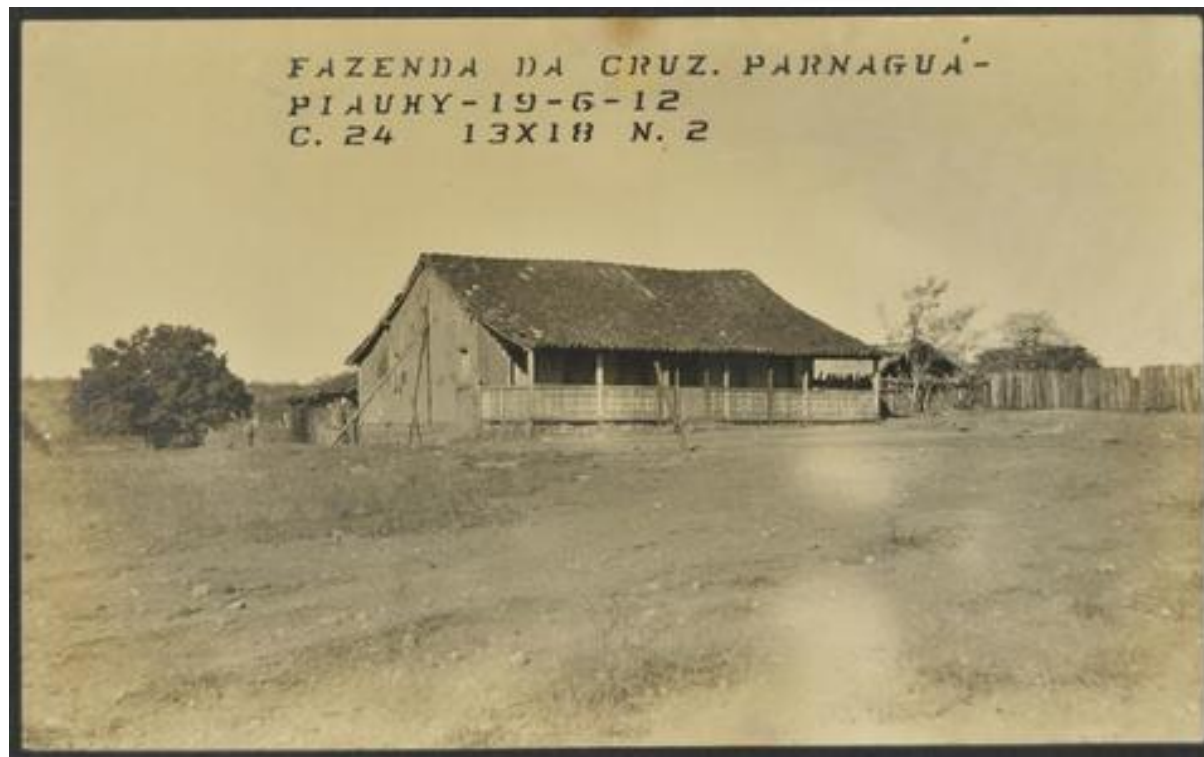
Sede de Fazenda. Parnaguá (PI), 1912.