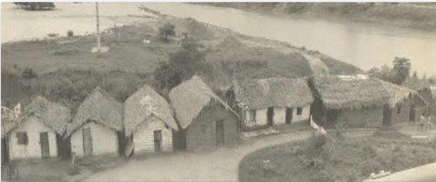
CASAS DE PALHA – COMUM ENTRE AS POPULAÇÕES RIBEIRINHAS