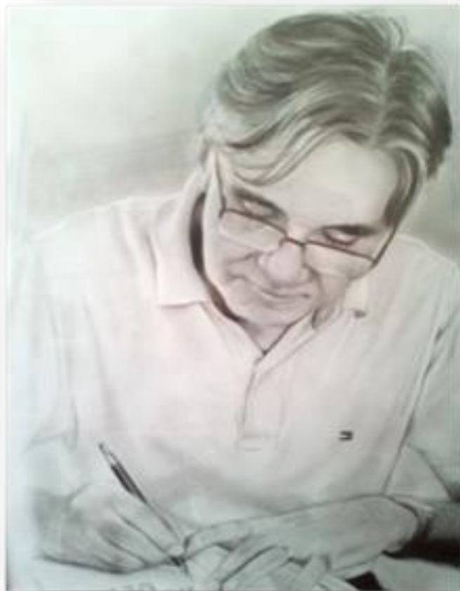
Arte de Rafael David