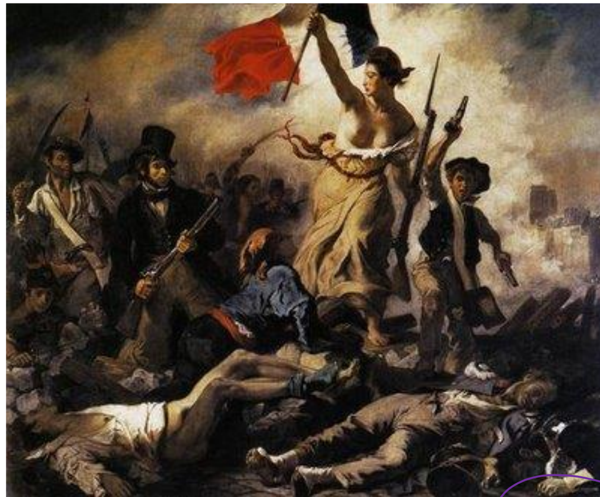
A liberdade conduzindo o povo (1830) – Delacroix