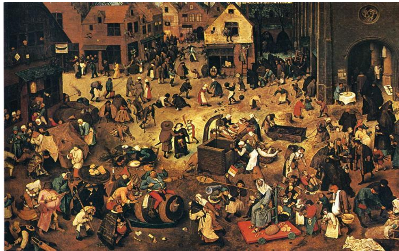
A LUTA ENTRE O CARNAVAL E A QUARESMA, PIETER BRUEGEL, O VELHO. 1559.