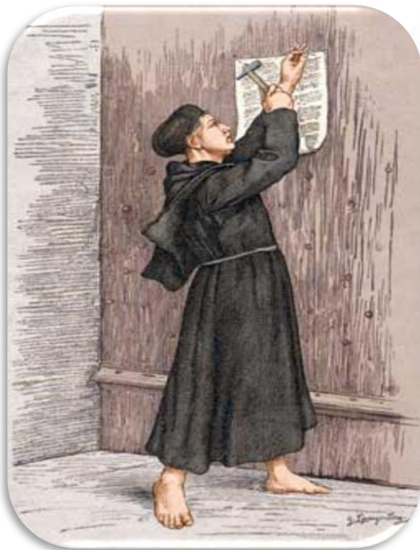
LUTERO FIXA AS 95 TESES EM WITTENBERG