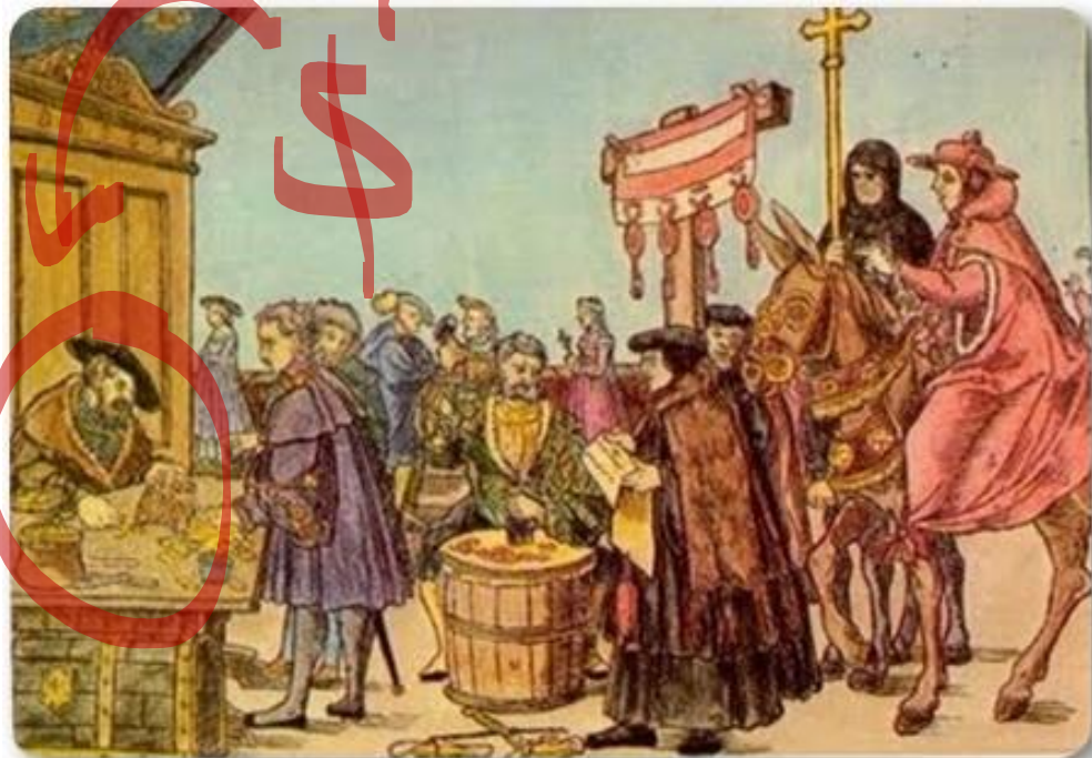
VENDA DAS INDULGÊNCIAS