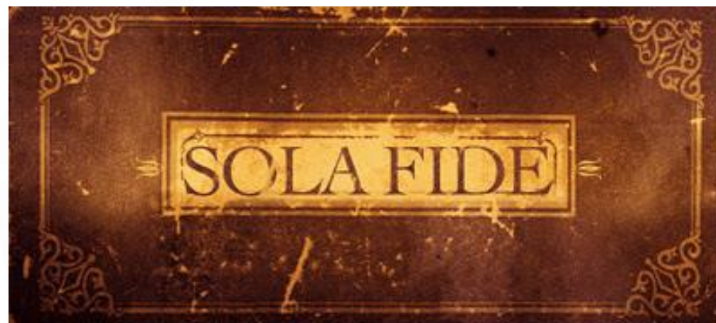
SÓ A FÉ SALVA