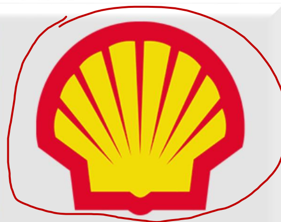
O Logotipo da Shell