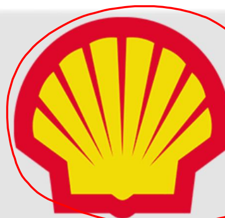
O Logotipo da Shell