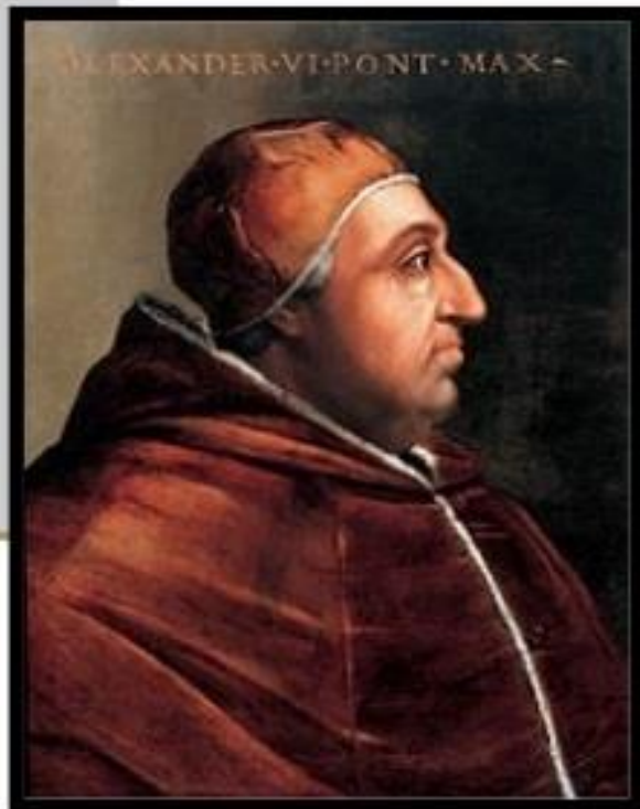
Papa Alexandre VI