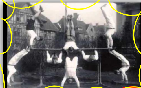
SEGUNDA ZONA- ESCOLA ALEMÃ