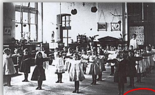
TERCEIRA ZONA- ESCOLA SUECA