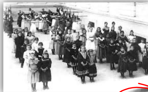
QUARTA ZONA- ESCOLA FRANCESA