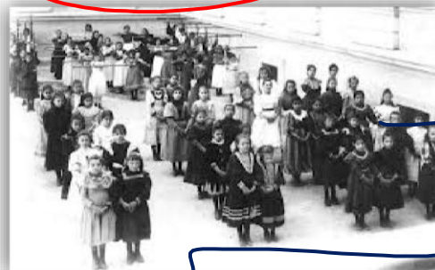
QUARTA ZONA- ESCOLA FRANCESA