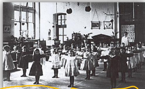
TERCEIRA ZONA- ESCOLA SUECA