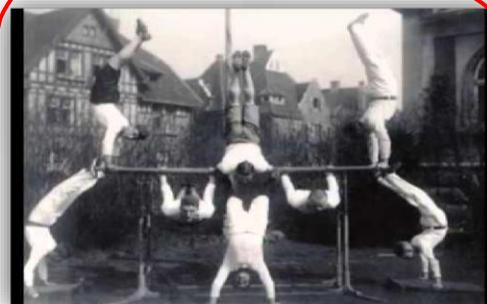
SEGUNDA ZONA- ESCOLA ALEMÃ