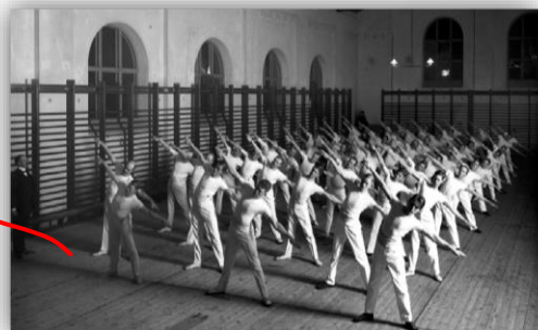
PRIMEIRA ZONA – ESCOLA INGLESA