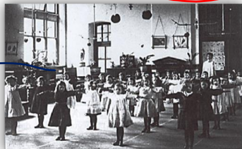
TERCEIRA ZONA- ESCOLA SUECA