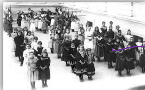
QUARTA ZONA- ESCOLA FRANCESA