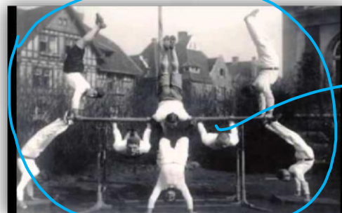
SEGUNDA ZONA- ESCOLA ALEMÃ