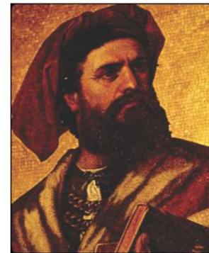
Figura 1.1: Marco Polo, um dos grandes empreendedores da história.

⇒ Entre 1271 e 1295 - Marco Polo tentou desenvolver uma rota comercial para o Oriente e, numa iniciativa empreendedora, firmou um contrato com um capitalista a fim de comercializar seus produtos. Suas viagens e ações caracterizaram a pessoa que pratica empreendedorismo, ou seja, uma pessoa empreendedora que assume riscos físicos e emocionais a fim de atingir seus objetivos.