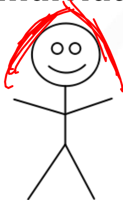
Imagem: Ileedev, Redrawn as SVG by Ben Liblit / Public Domain