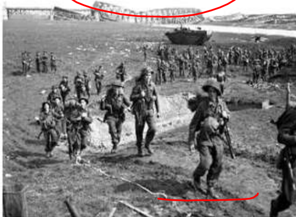
Guerra de movimento