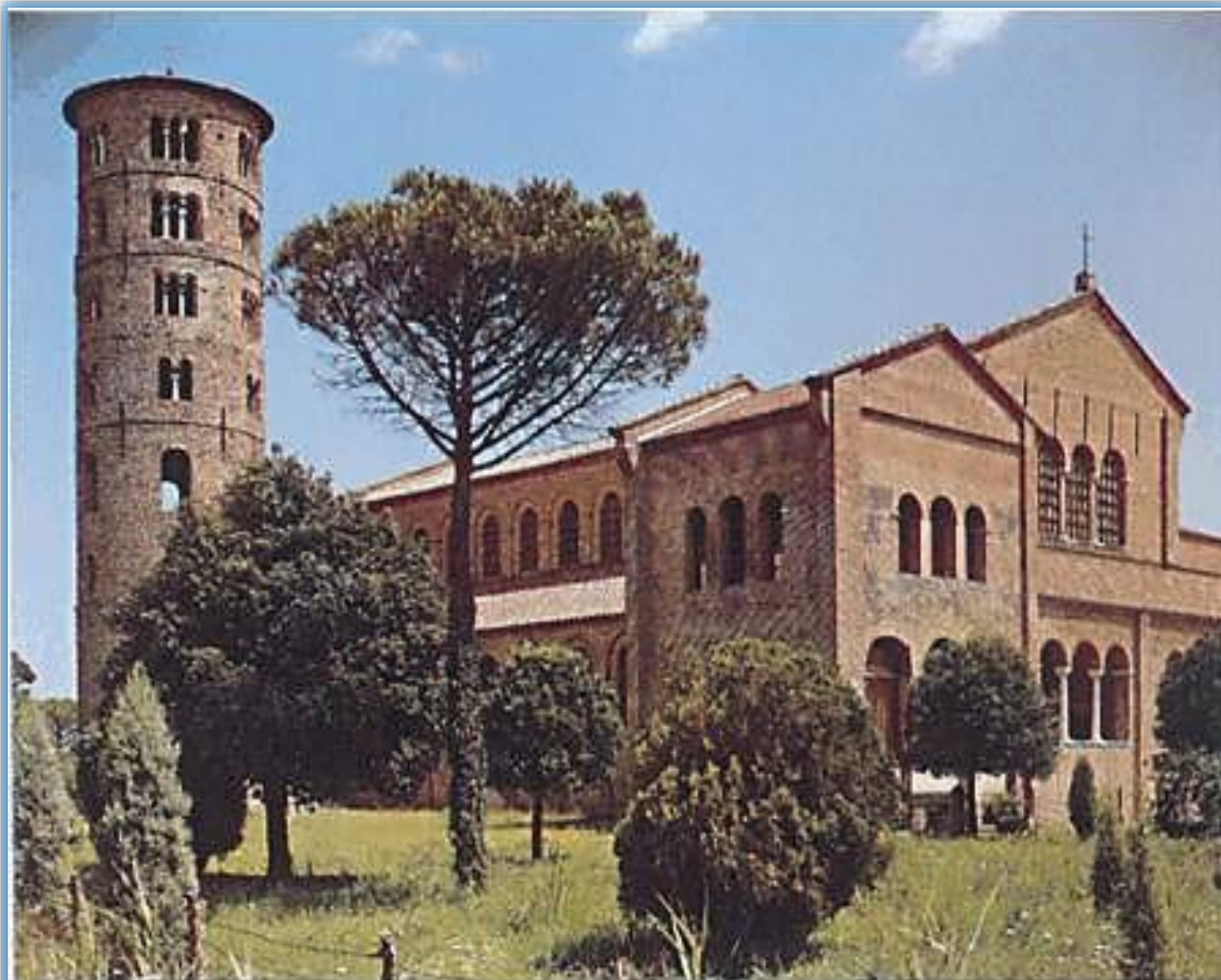
Igreja de Santo Apolinário Novo, em Ravena, Itália