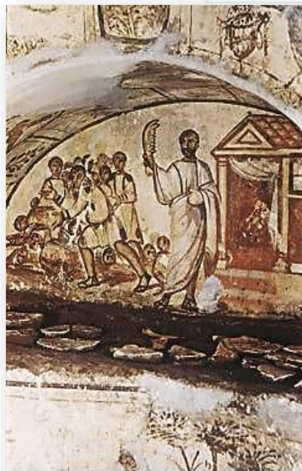
Sansão matando os filiseus, Catacumba da Via Latina, Roma