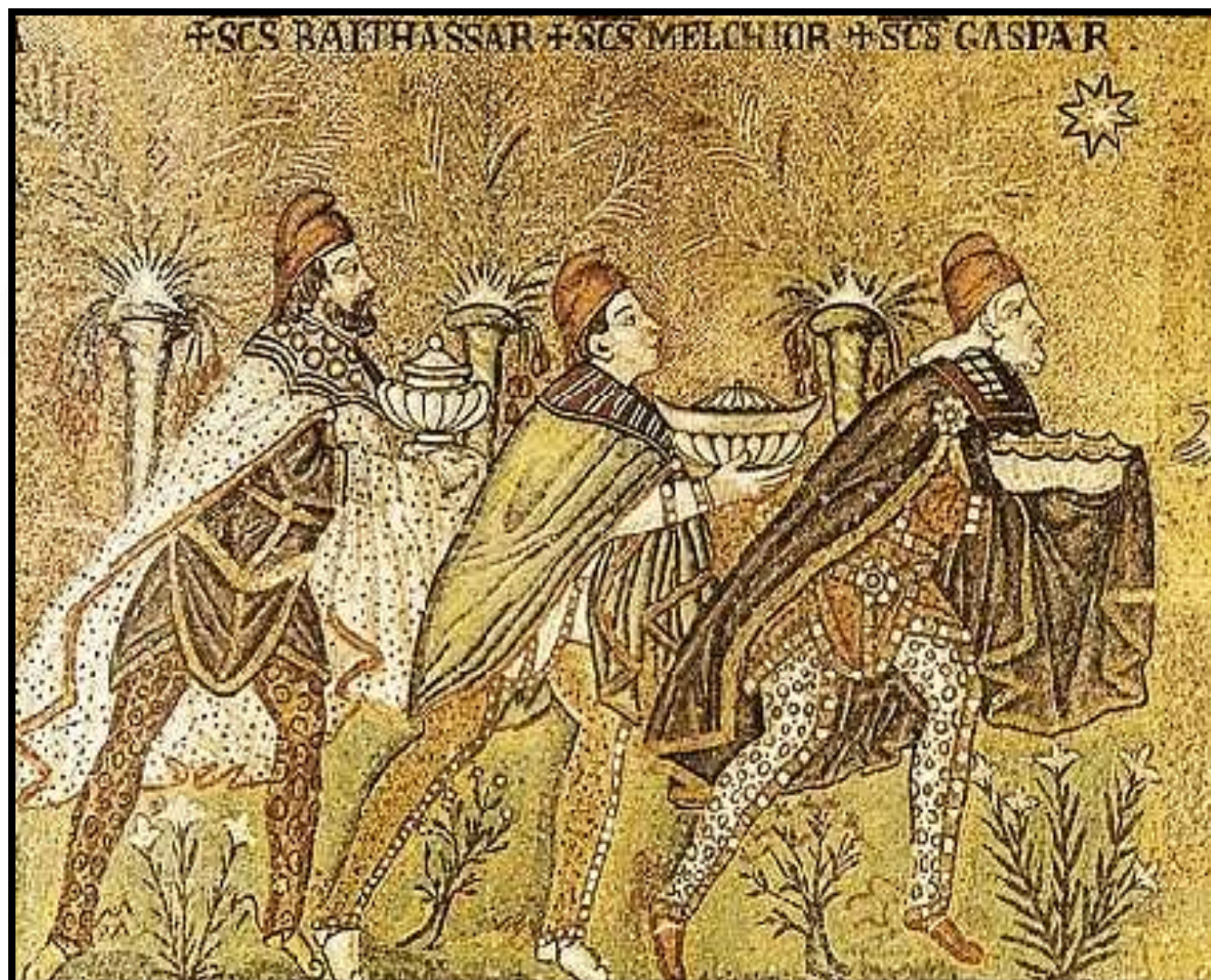
Mosaico na Igreja de Santo Apolinário Novo, em Ravena, Itália, representa os Reis Magos, século VI