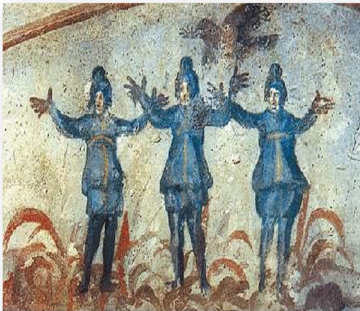
Sidrac, Misac e Abdêgano atirados na fomalha por Nabucodonosor, Catacumba de Santa Priscila, Roma, séc. III-IV