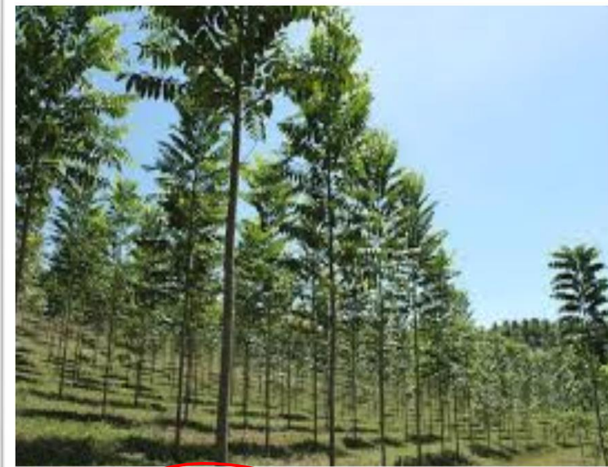
Floresta de Cedro.