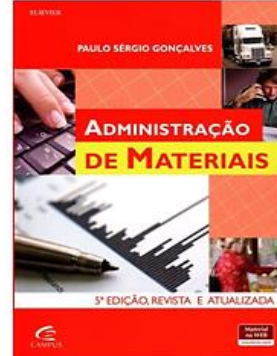
Administração de Materiais - 5ª Ed. 2016 - Campus