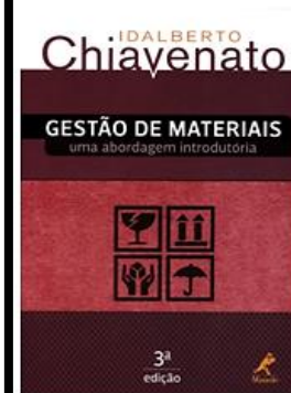
Gestão de Materiais 3ª Ed, 2014 - Manole