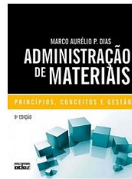
Administração de Materiais - Princípios, Conceitos e Gestão - 6ª Ed. 2016 - Atlas