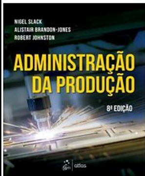
Administração da Produção - 8ª Ed. 2018 - Atlas