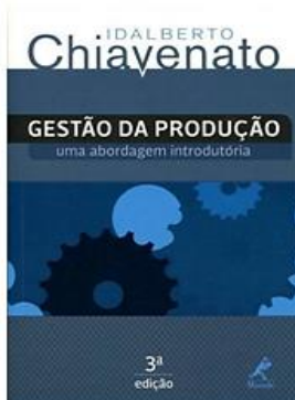
Gestão de Produção 3ª Ed, 2014 - Manole