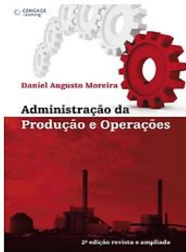
Administração da Produção e Operações - 2ª Ed. 2008 - Cengage Learning