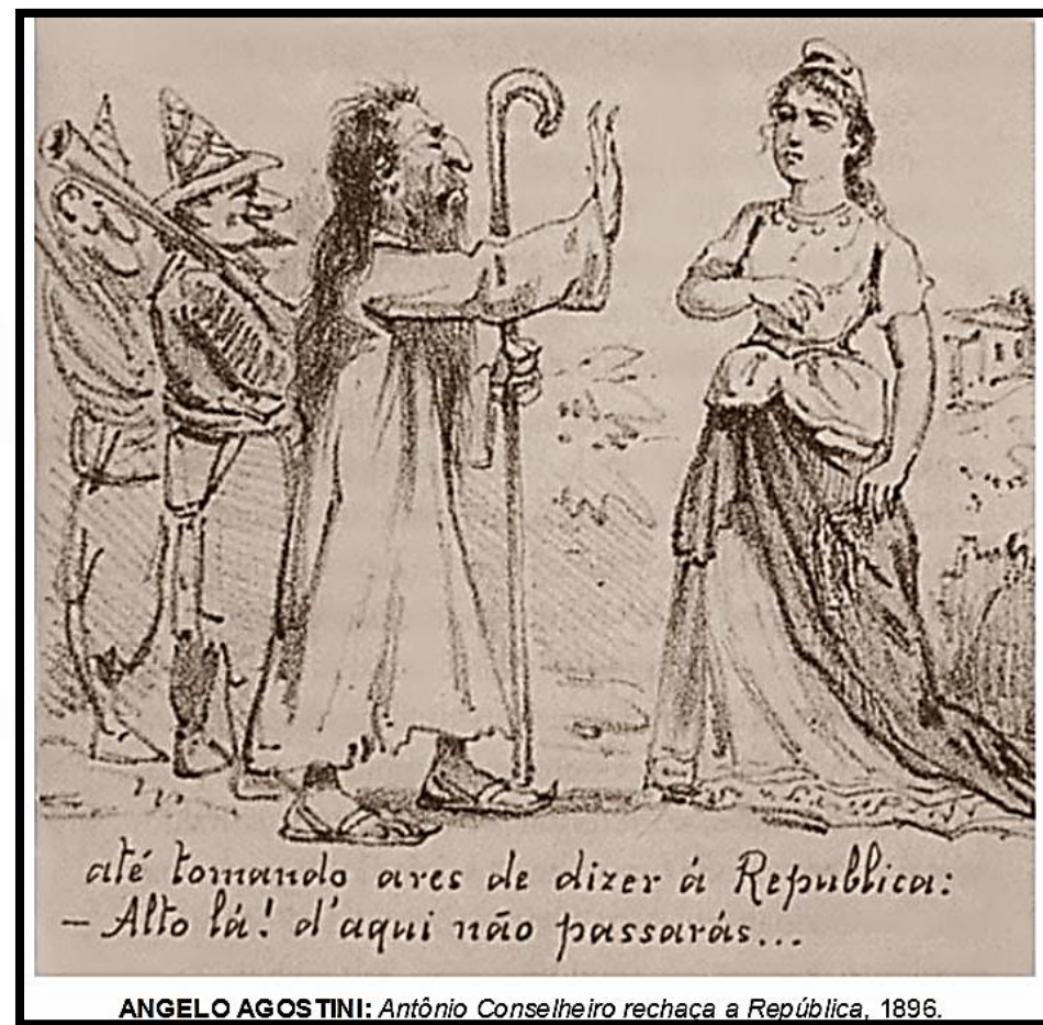
ANGELO AGOSTINI: Antônio Conselheiro rechaza a República, 1896.