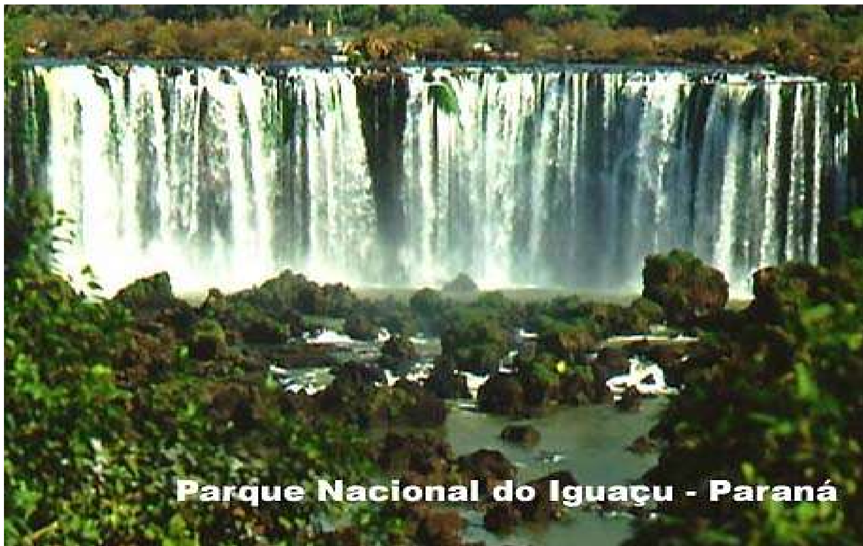
Parque Nacional do Iguaçu - Paraná