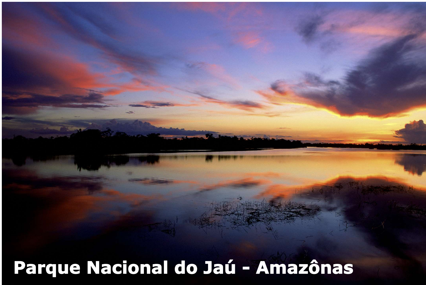
Parque Nacional do Jaú - Amazonas