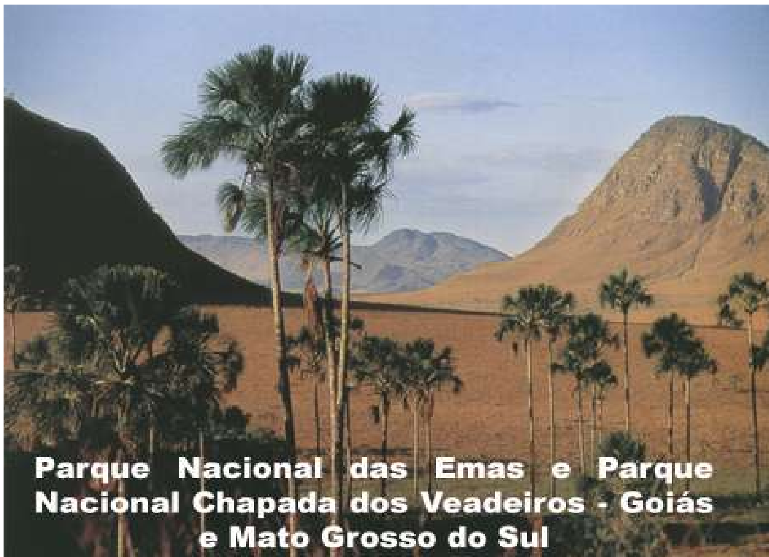
Parque Nacional das Emas e Parque Nacional Chapada dos Veadeiros - Goiás e Mato Grosso do Sul