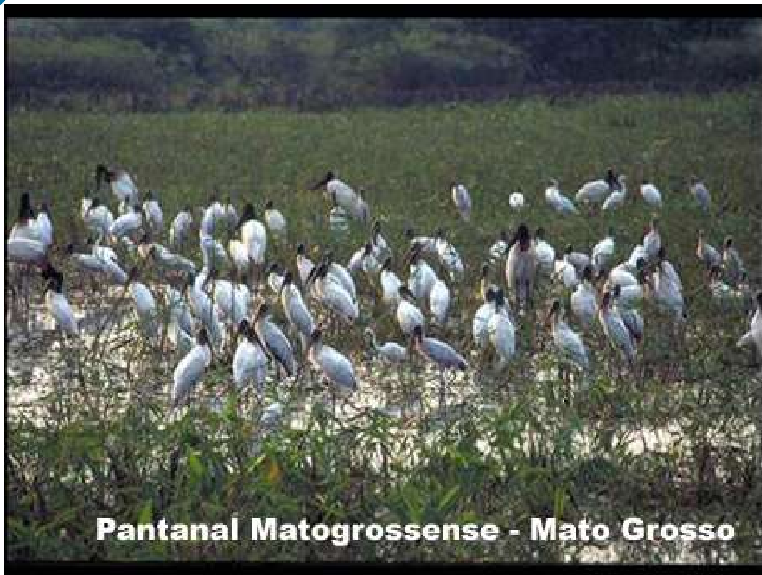
Pantanal Matogrossense - Mato Grosso