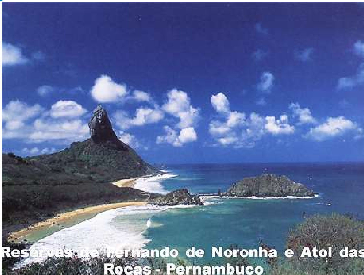
Reservas de Fernando de Noronha e Atol das Rocas - Pernambuco