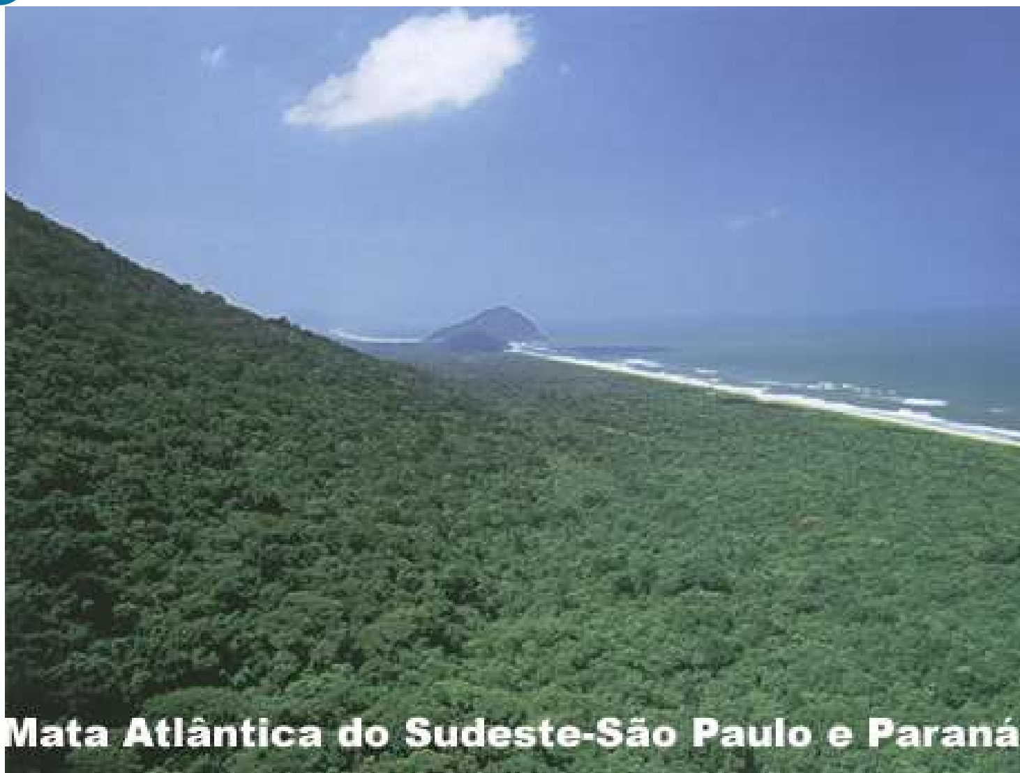
Mata Atlântica do Sudeste-São Paulo e Paraná