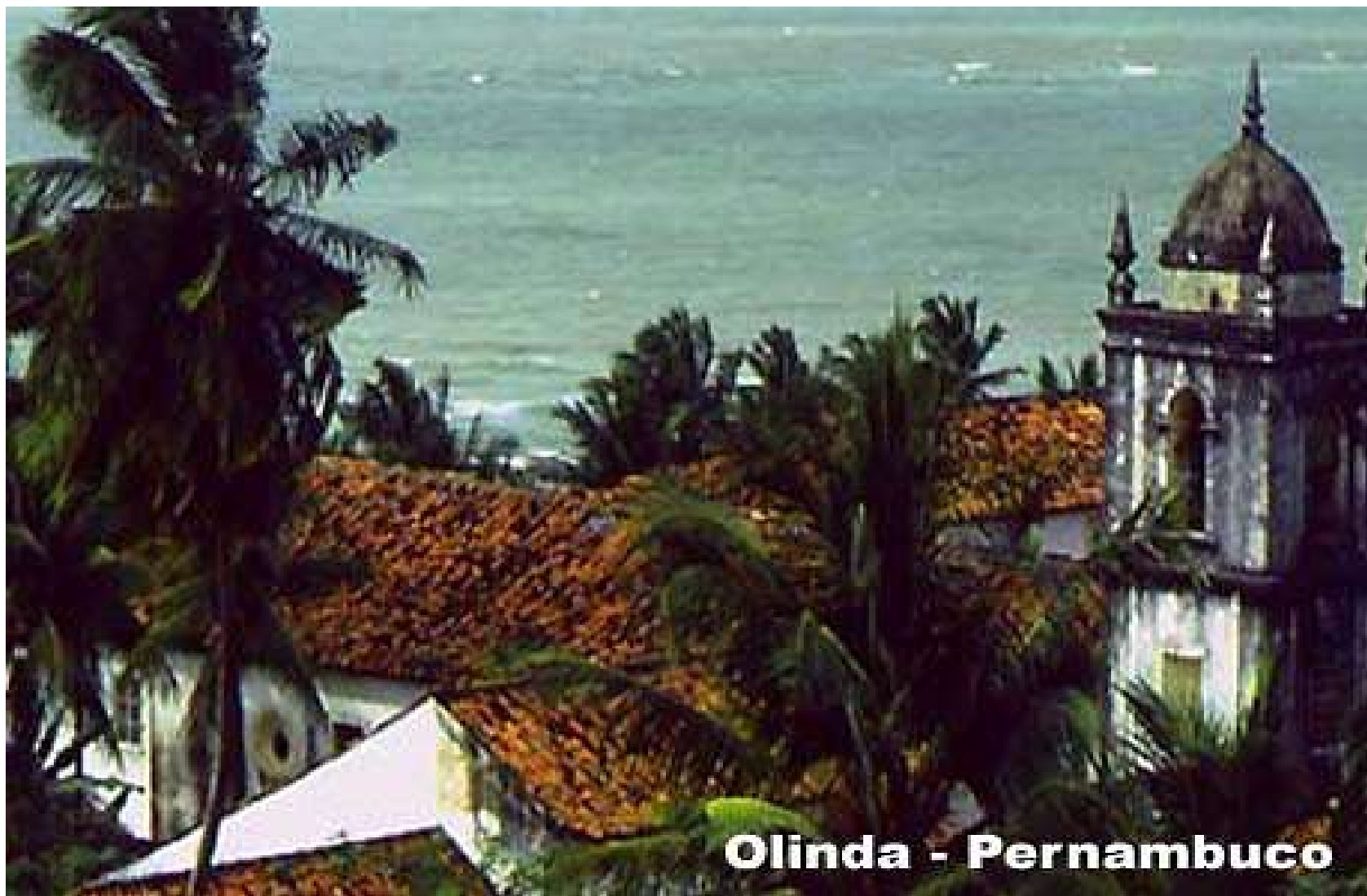
Olinda - Pernambuco