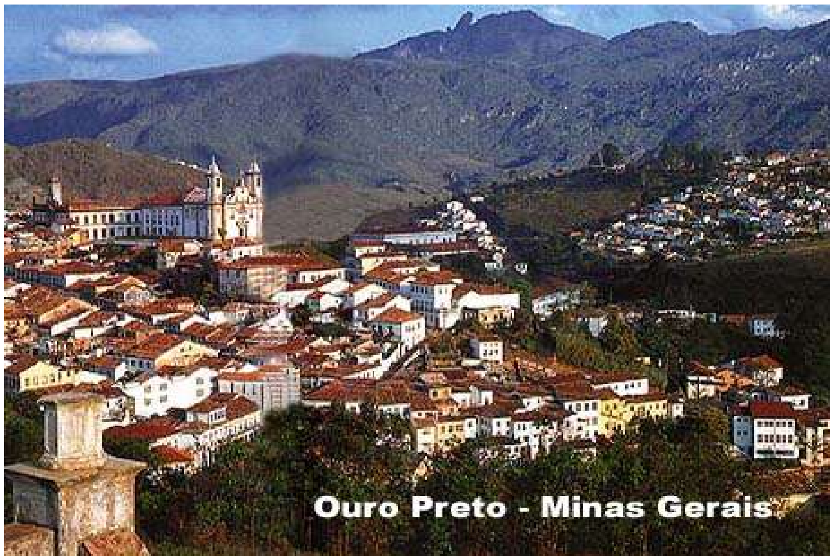
Ouro Preto - Minas Gerais