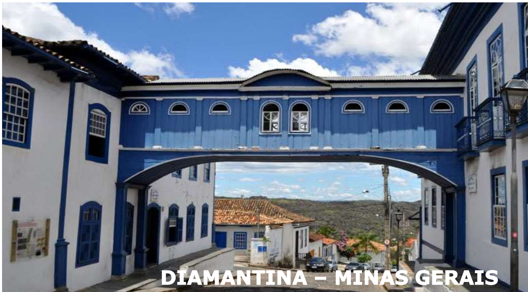
DIAMANTINA – MINAS GERAIS