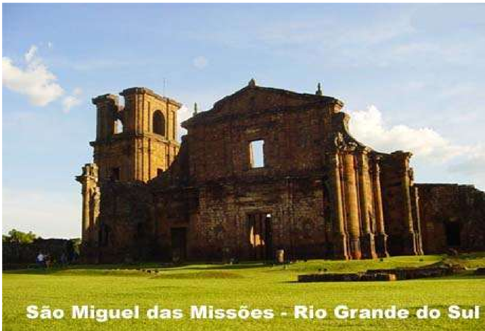
São Miguel das Missões - Rio Grande do Sul