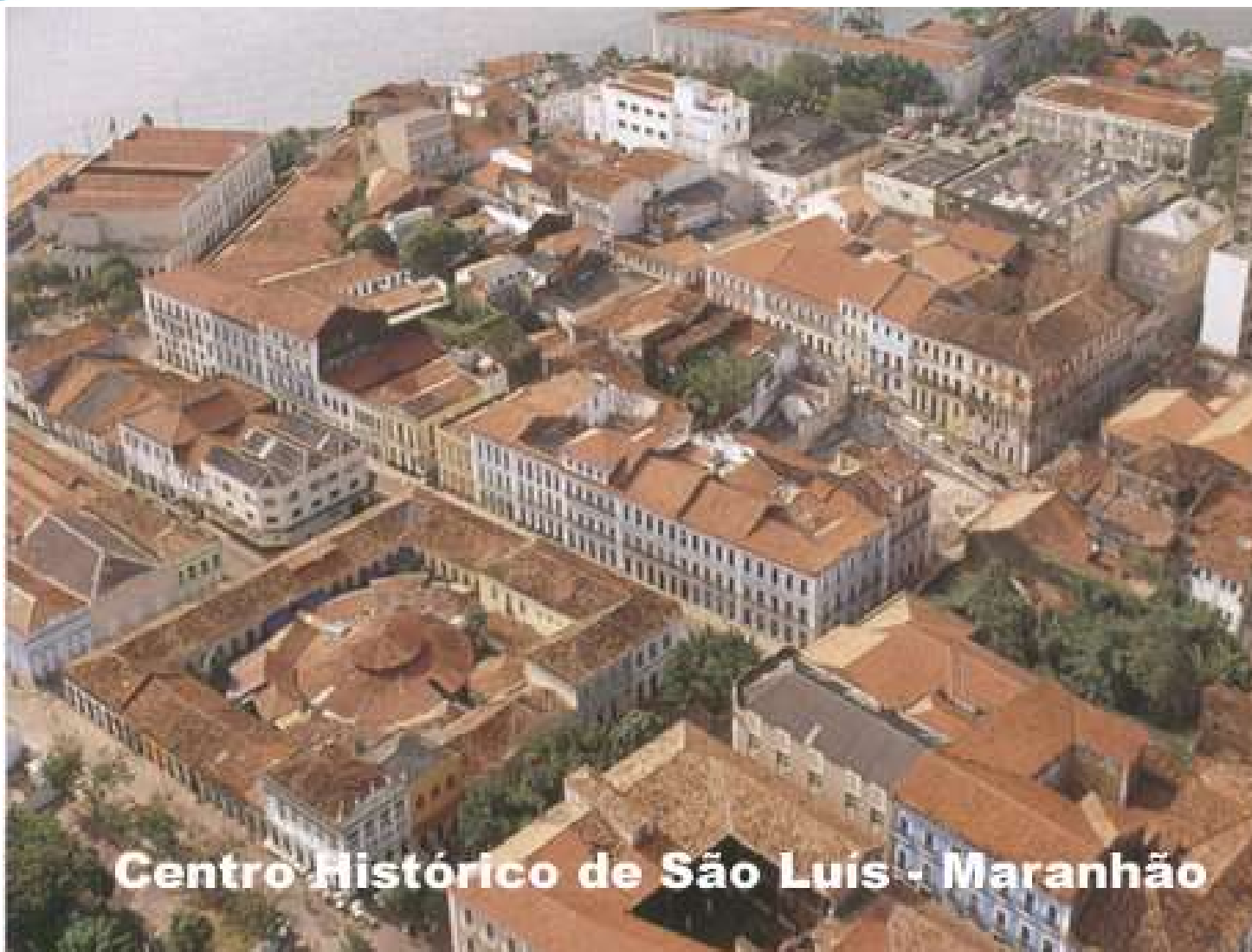
Centro Histórico de São Luís - Maranhão