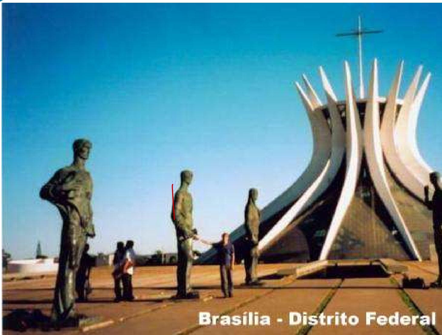
Brasilia - Distrito Federal