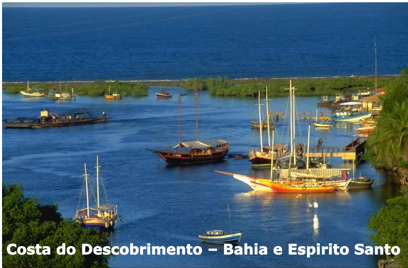
Costa do Descobrimento – Bahia e Espírito Santo