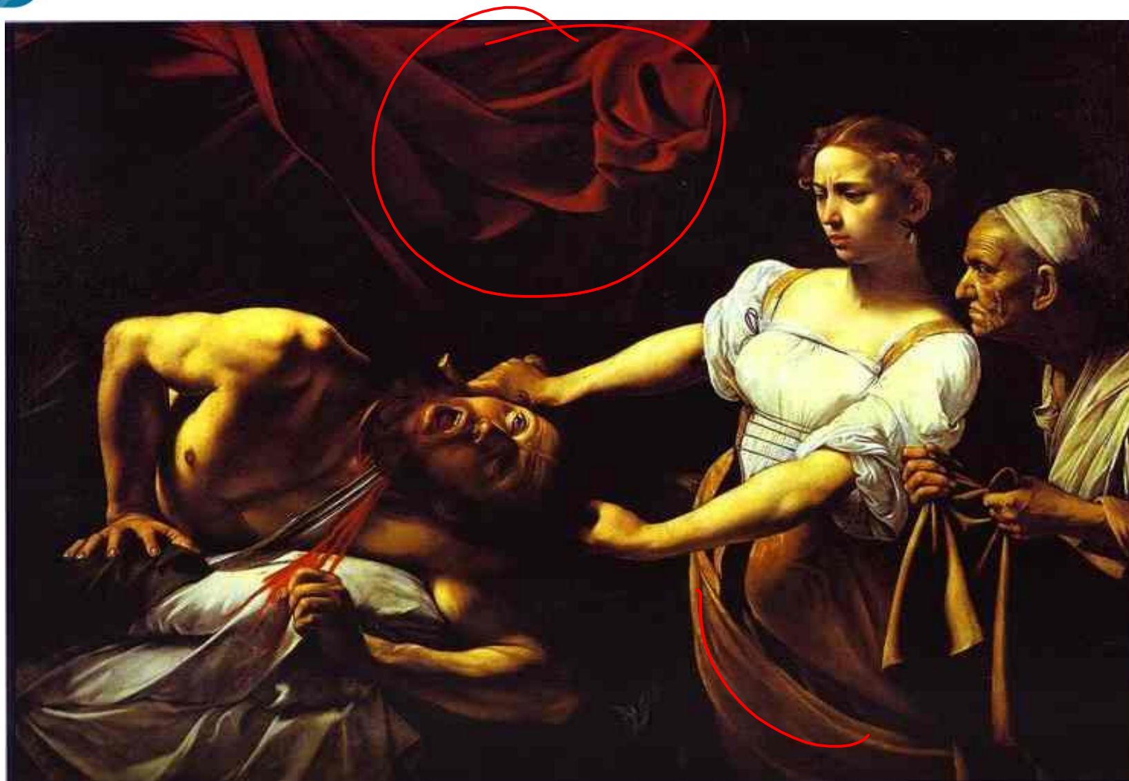
Judith degola Holofernes