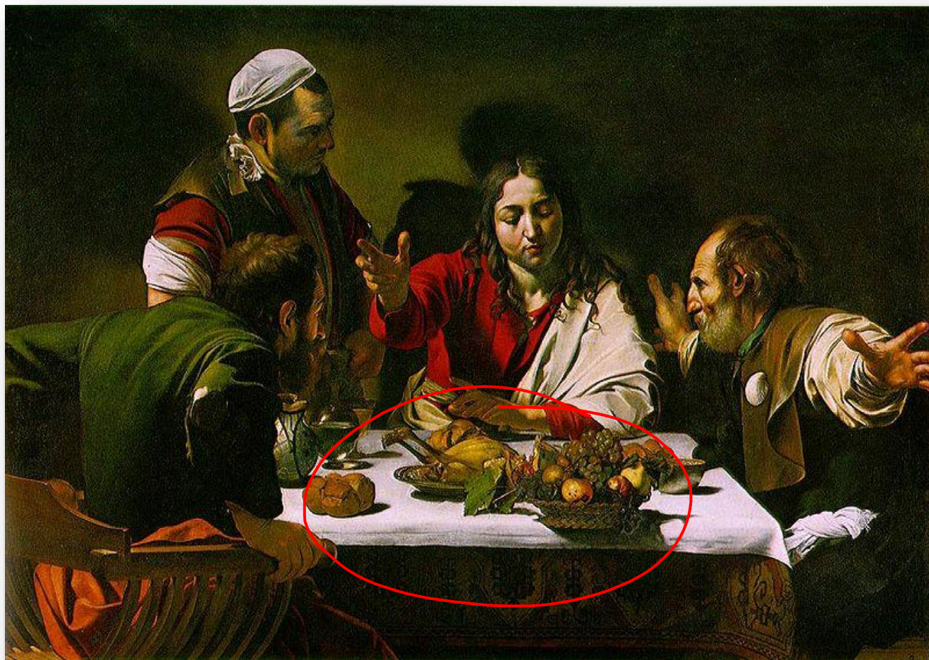
A ceia em Emaús