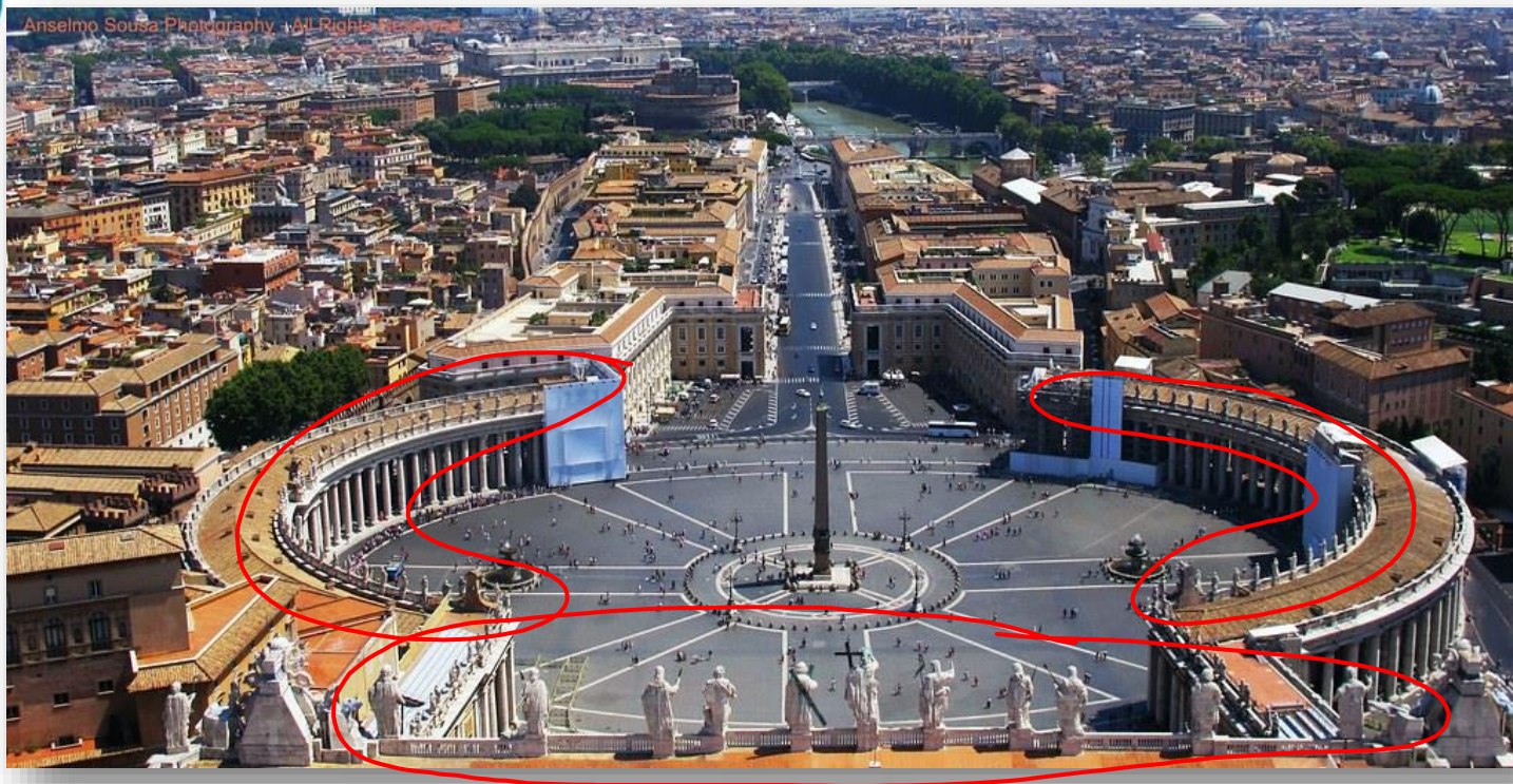
Praça de São Pedro- Bernini