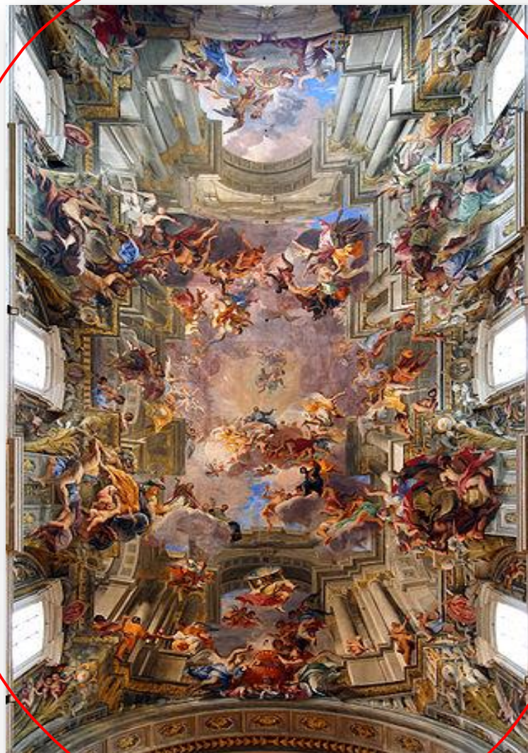
A glória de Santo Inácio – Andrea Pozzo