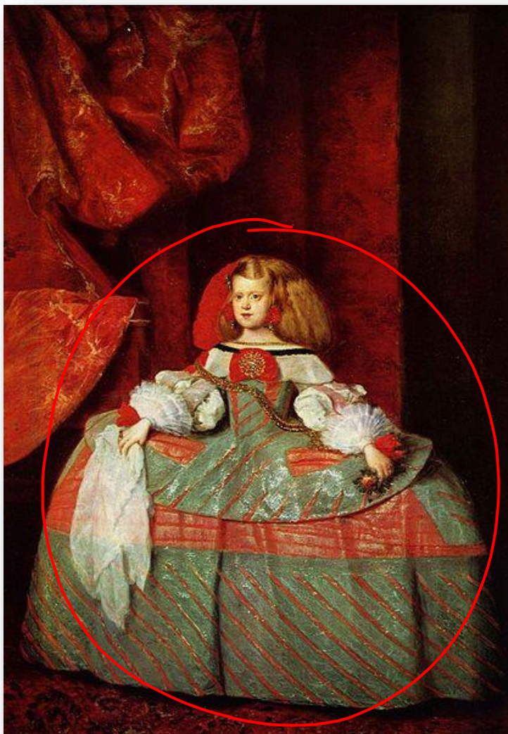
Infanta Margarita da Áustria - Diego Velázquez