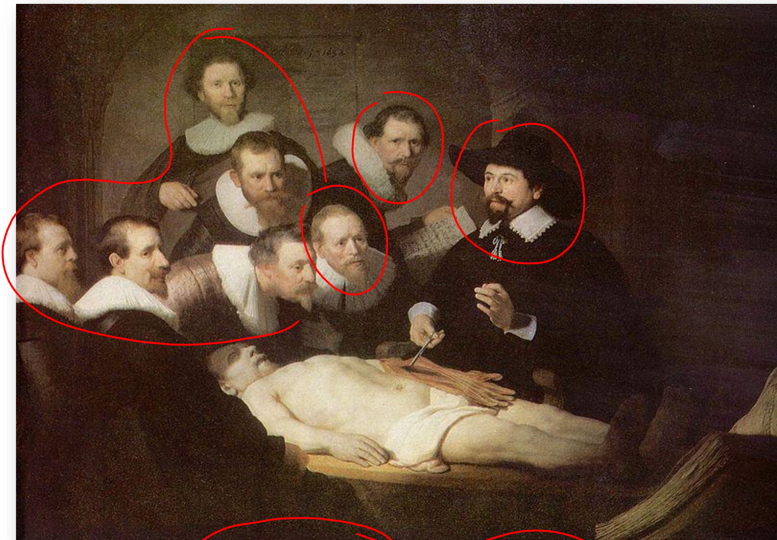
Aula de anatomia- Rembrandt