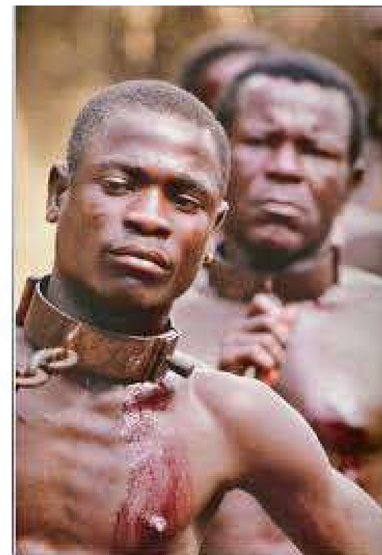
ESCRavidão DE NEGROS AFRICANOS