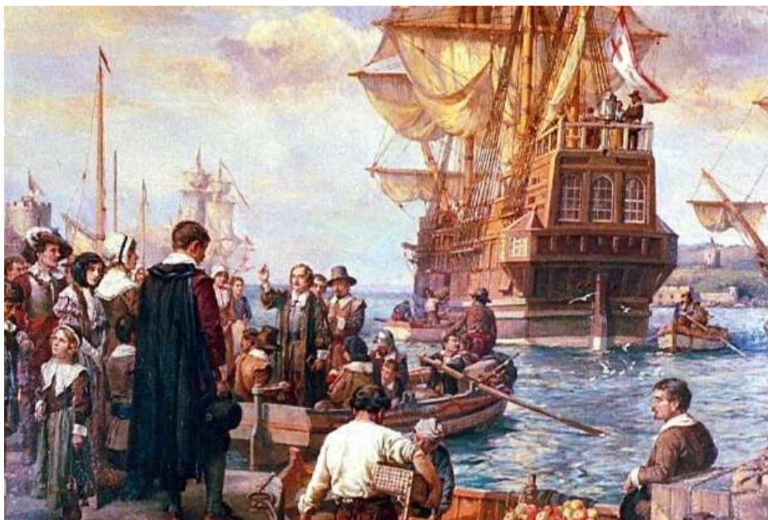
MAYFLOWER: PROTESTANTES PURITANOS