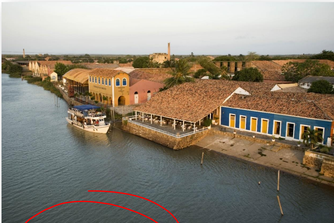
Porto das Barcas – Parnaíba Beira Rio Igarau