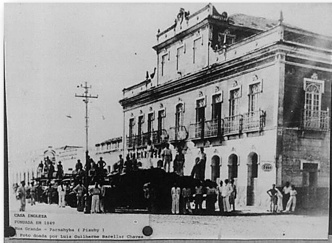
Comércio Forte: exportação/importação Casa Inglesa