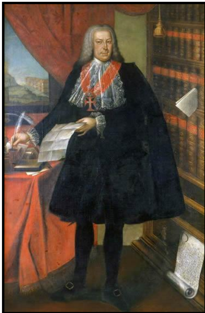
Retrato de Pombal. 1770. Joana do Salitre.