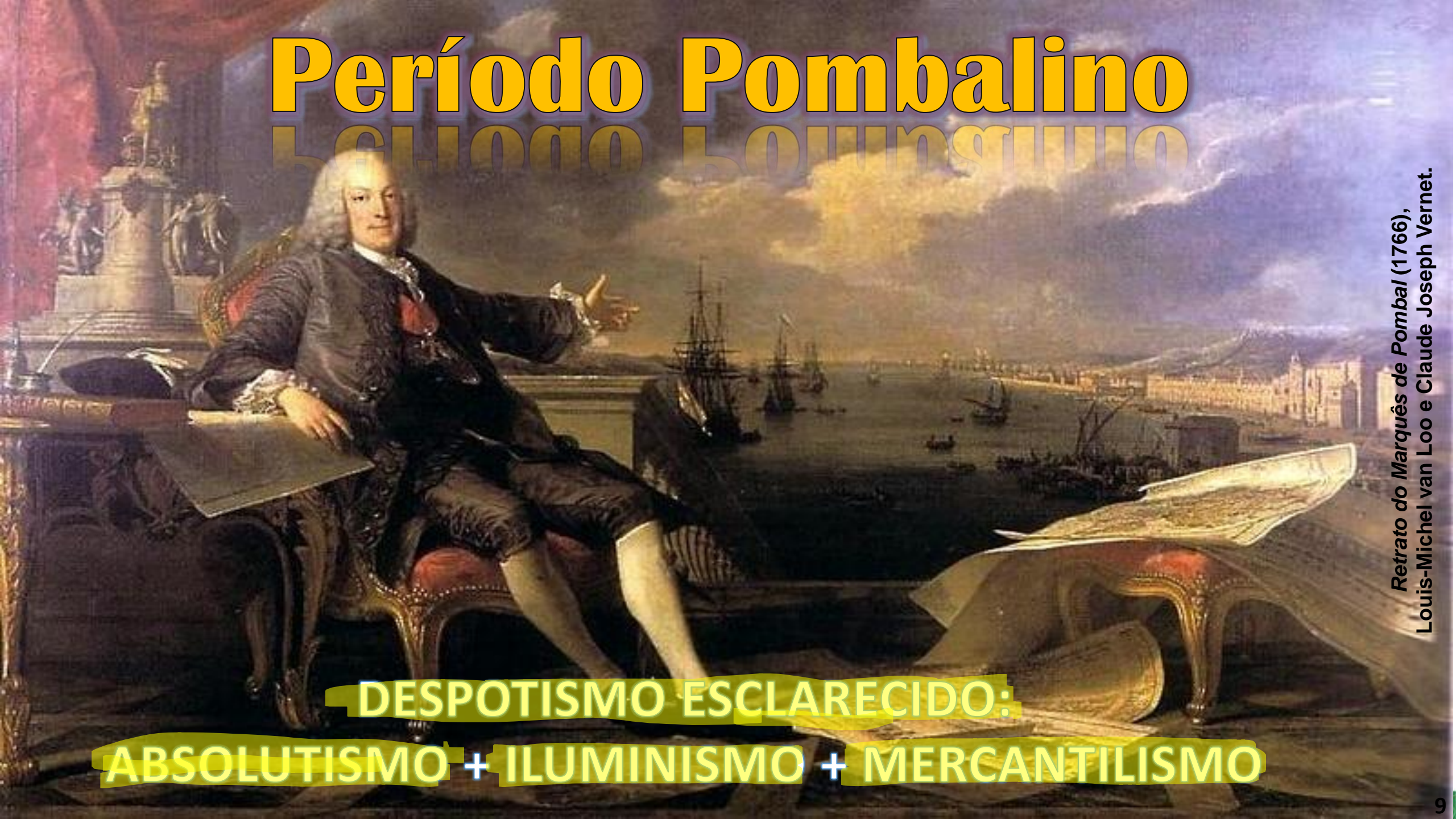
Retrato do Marquês de Pombal (1766), Louis-Michel van Loo e Claude Joseph Vernet.