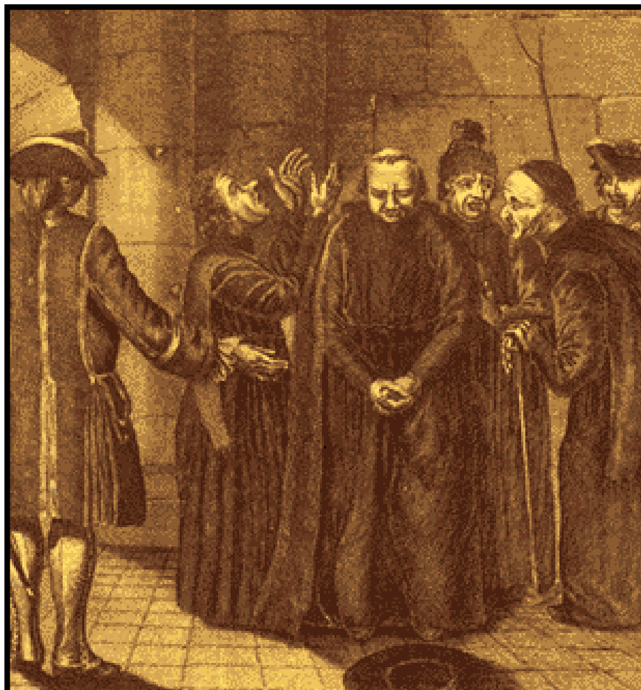
Gravura que satiriza o desamparo dos jesuítas ao serem expulsos da Colônia