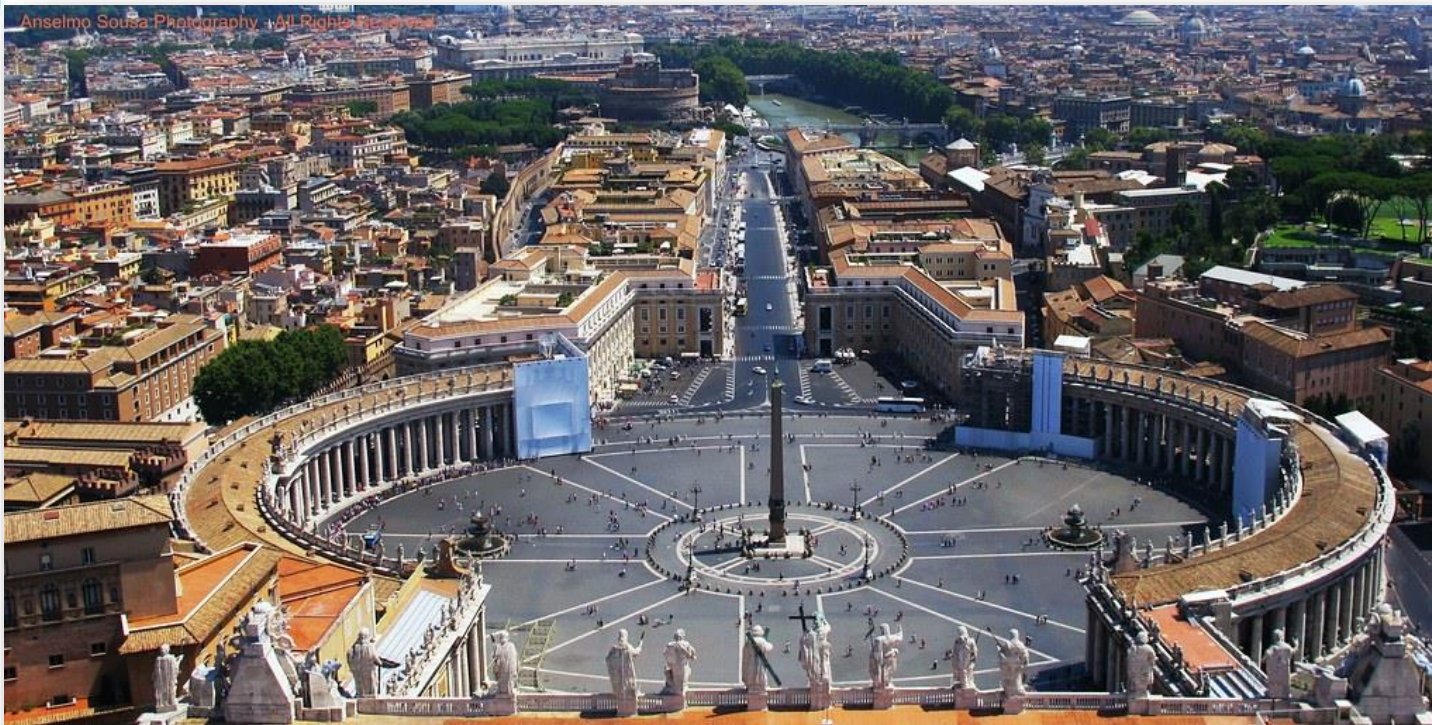
Praça de São Pedro- Bernini