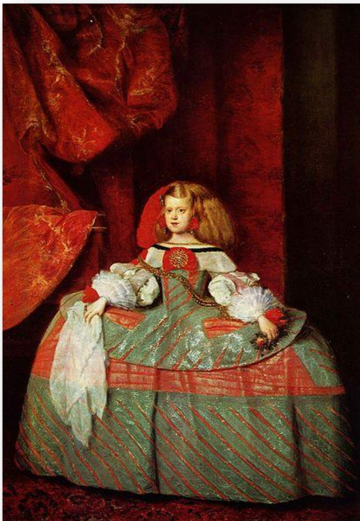
Infanta Margarita da Áustria - Diego Velázquez