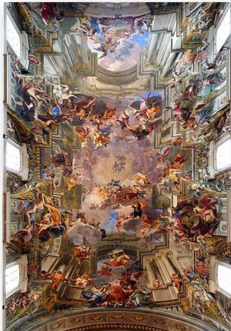
A glória de Santo Inácio – Andrea Pozzo