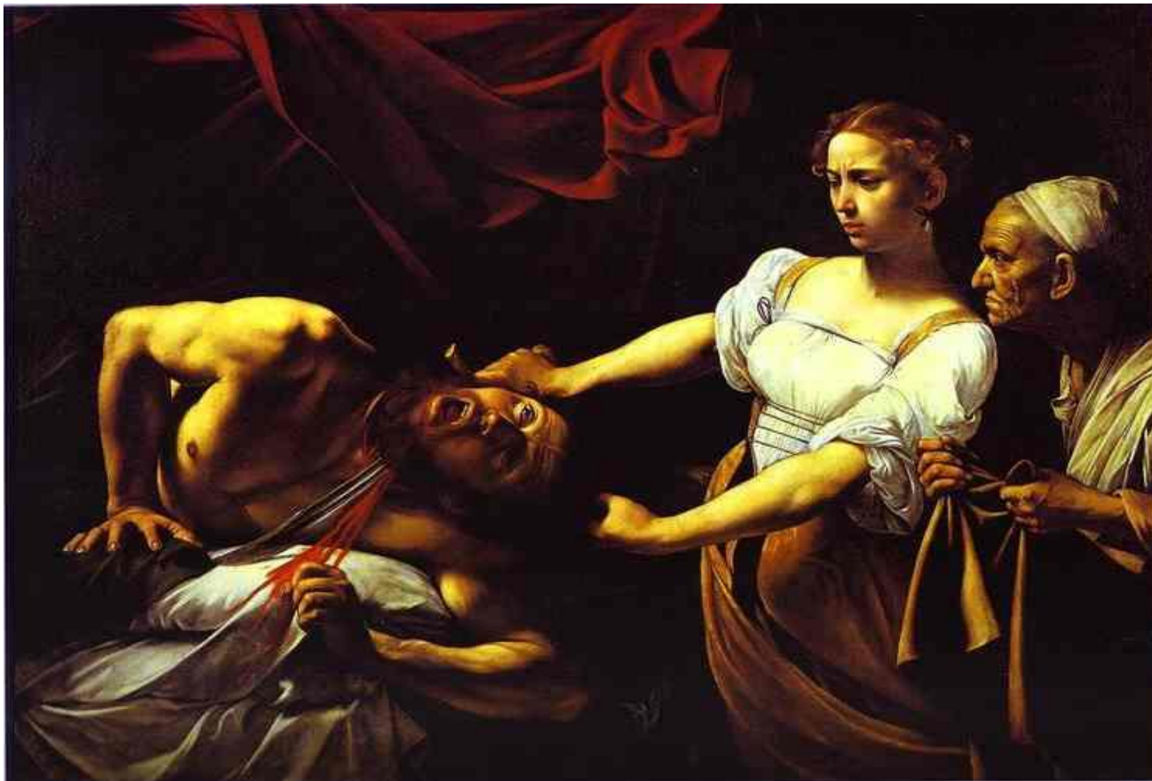
Judith degola Holofernes