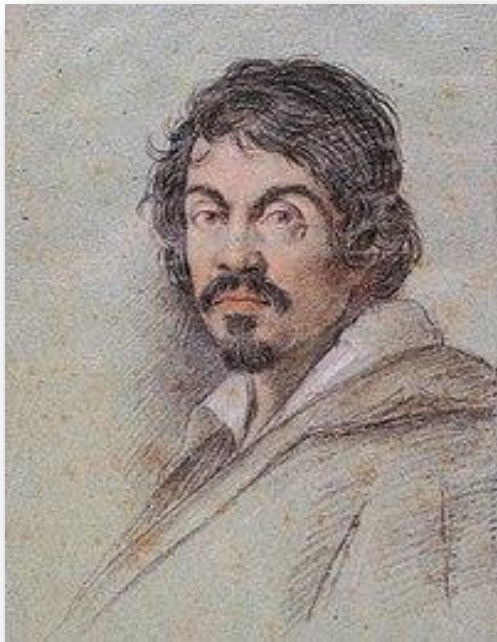
Caravaggio, pintura de Ottavio Leoni .