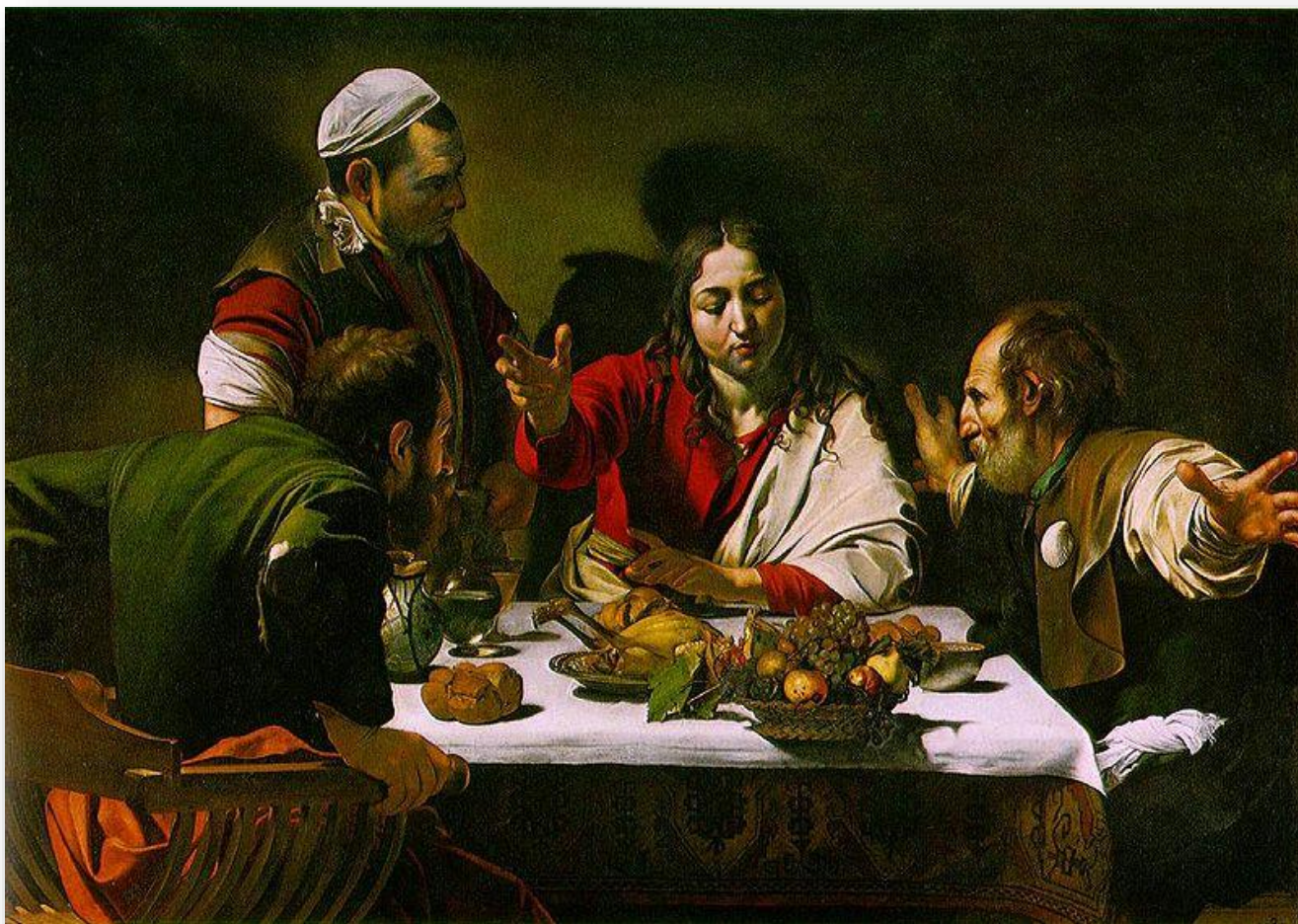
A ceia em Emaús