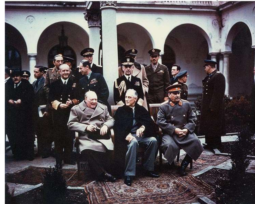
Photo # USA C-543 Churchill, Roosevelt & Stalin at the Yalta Conference, February 1945