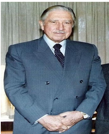
Ditador chileno Augusto Pinochet.

Com a queda do governo socialista de Salvador Allende, na década de 70, assume o poder no Chile o ditador Augusto Pinochet, fazendo com que o Chile, antes das mesmo das potências europeias e americanas, seja o primeiro país a de fato implantar políticas neoliberais. O que de certa forma viria a contribuir para que outros países da América Latina, como o Brasil, com Fernando Henrique Cardoso, a Argentina e o México, adotassem o mesmo sistema anos mais tarde.