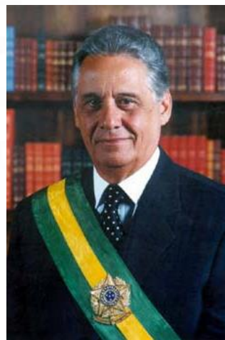
Presidente brasileiro Fernando Henrique que, em seu governo, promoveu uma série de privatizações de empresas pública.

Imagem: Augusto Pinochet / Autor Desconhecido / Public Domain.