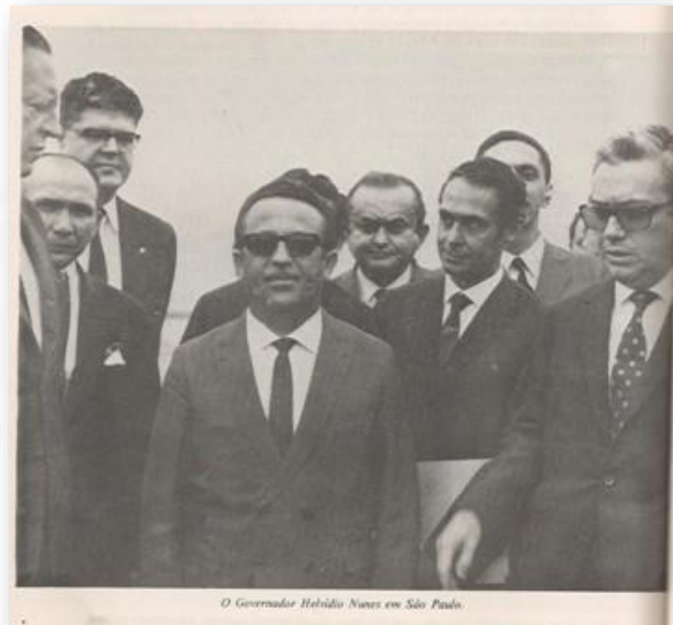
O Governador Helvídio Nunes em São Paulo.