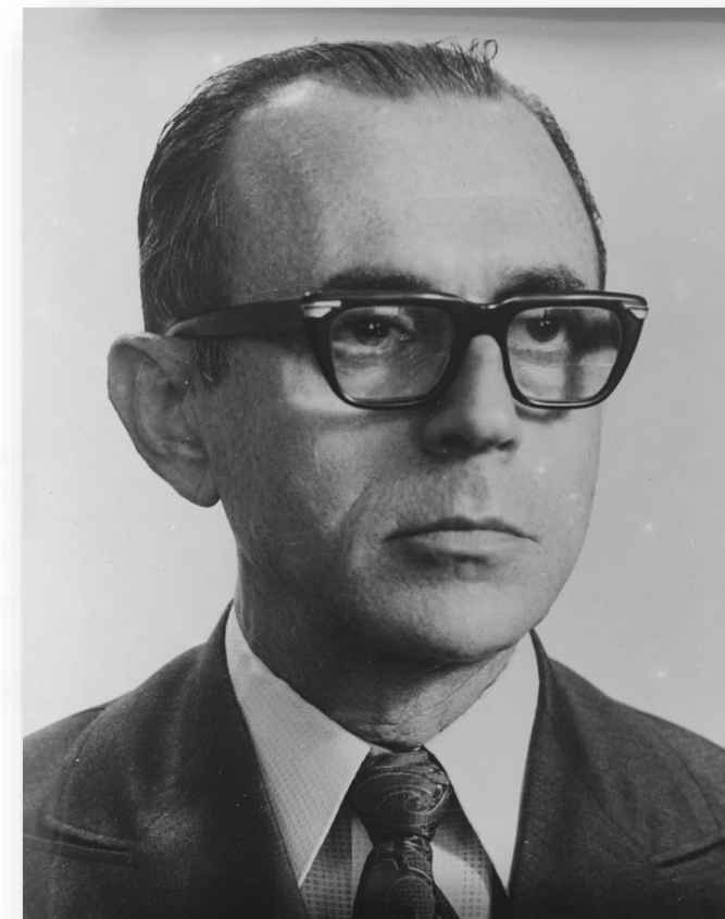
Governador Alberto Silva