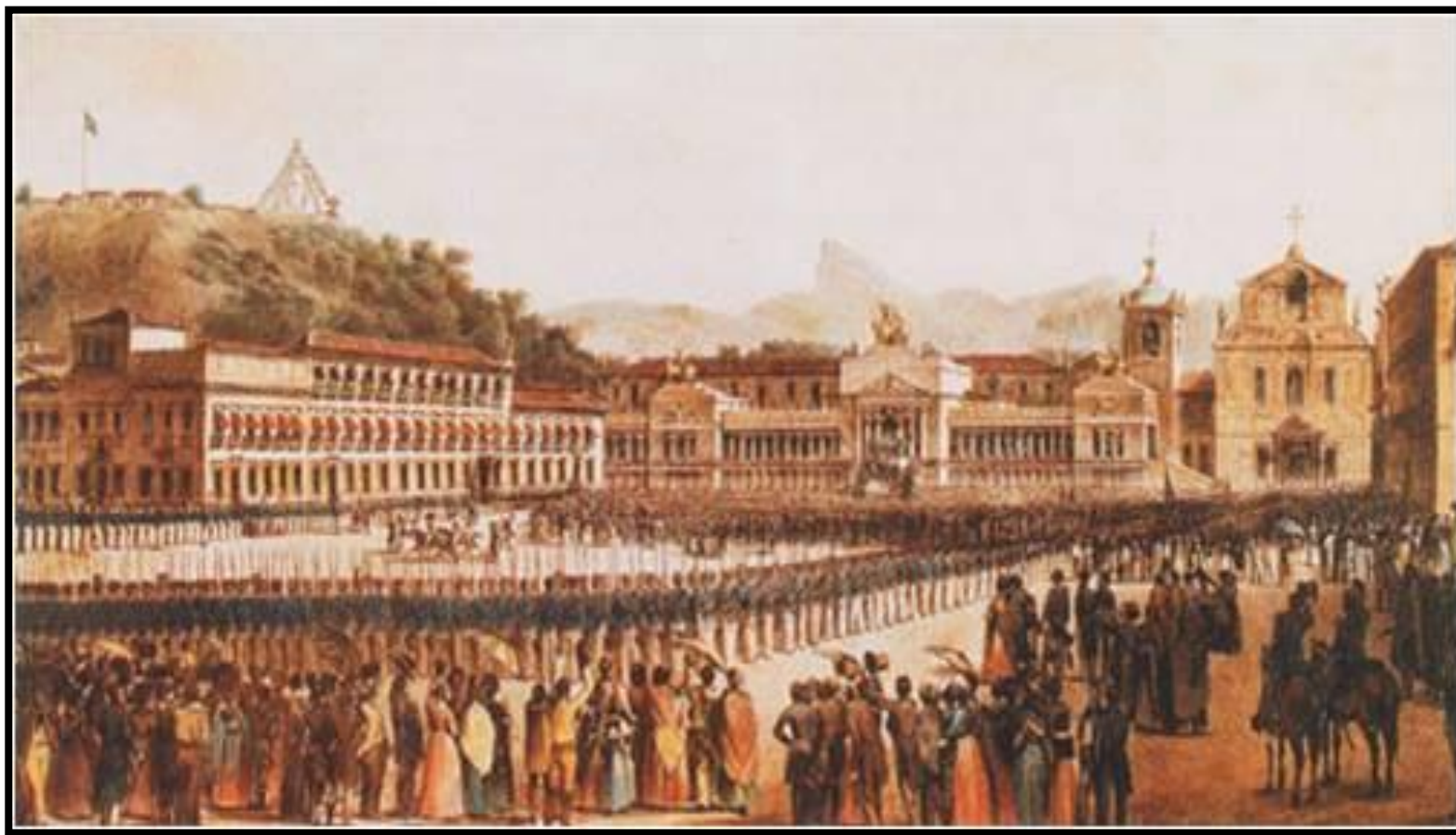
Aclamação de Dom Pedro II