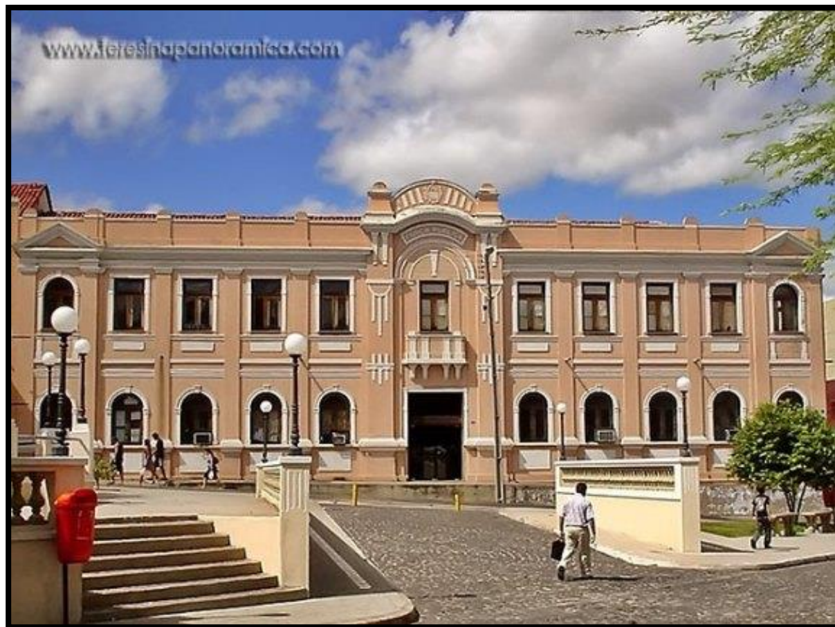
Quartel Militar durante o Regime. Hoje Centro de Artesanato Mestre Dezinho

“O calabouço abaixo do ateliê é um verdadeiro buraco medieval, sem janelas, sufocante, que ainda traz as marcas de sangue e das cassetadas nas paredes”. “Essa sala tem as marcas do tempo. Um tempo sombrio e amargo”.