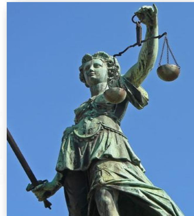
Imagem: Advocatheek1 / A espada e a balança, símbolos da Justiça / Domínio público