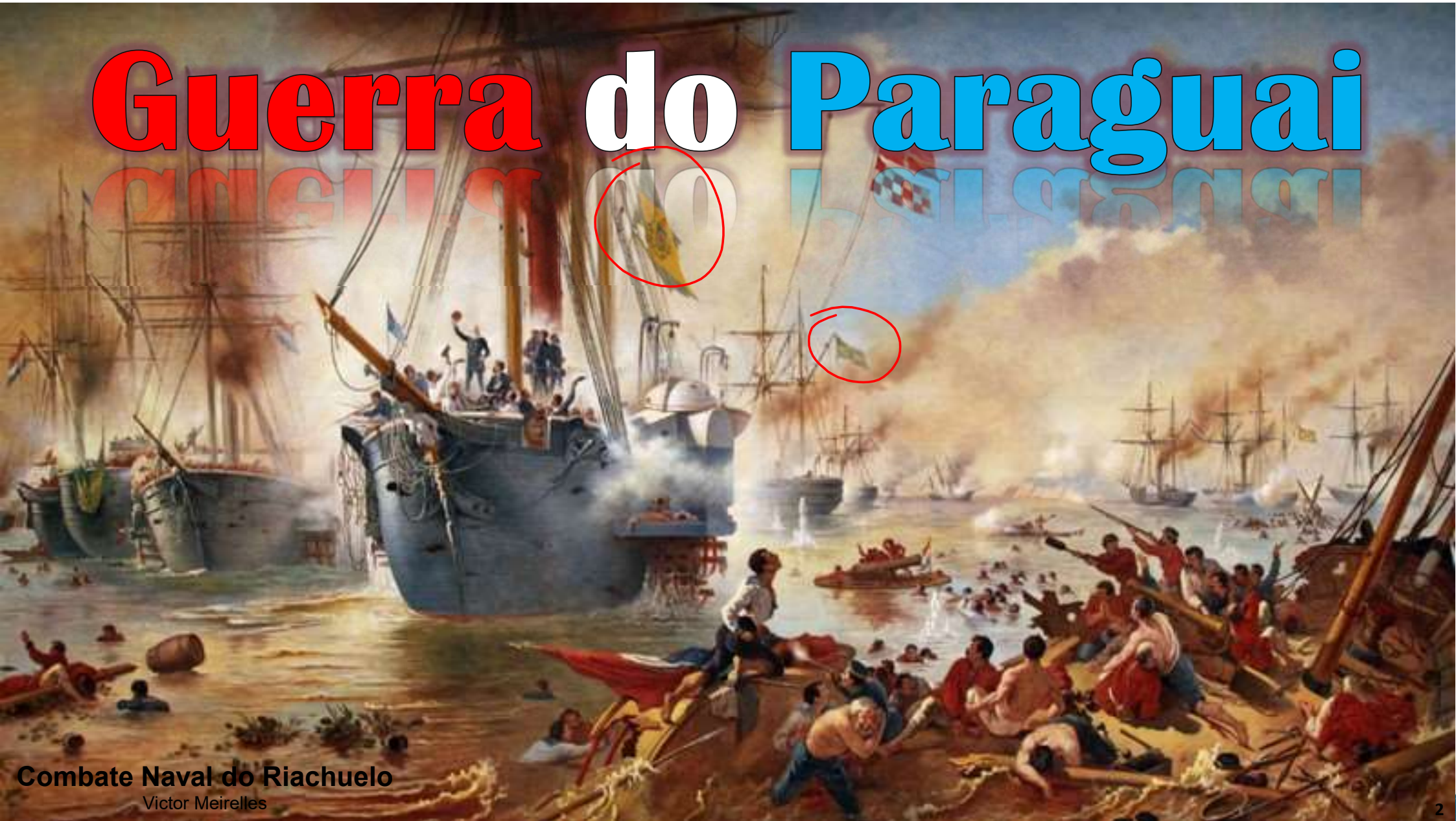
Combate Naval do Riachuelo