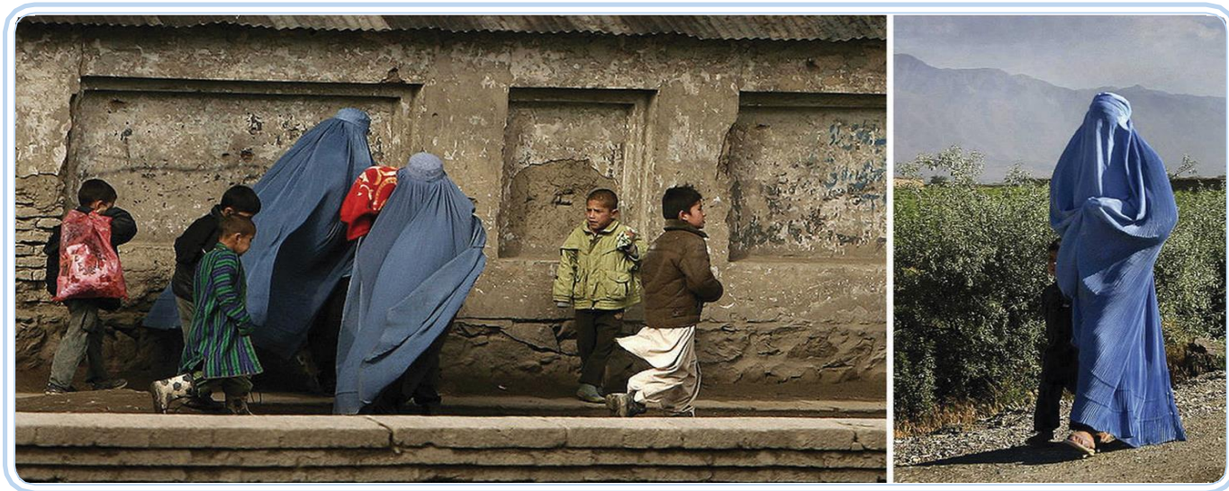
Figura 1.1: Burka – vestimenta obrigatória para as mulheres muçulmanas.

Cada sociedade tem sua ética própria, assim, não podemos dizer que há certo ou errado quando se compara o papel que se atribui à mulher no ocidente com aquele preconizado no Oriente Médio ou na cultura muçulmana. Veja o exemplo da Figura 1.1, em que a mulher muçulmana está usando uma burka, vestimenta que não é adotada pela mulher ocidental.