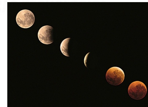
Imagem: éclipse de Lune en Belgique à Hamois/ Luc Viatour / GNU Free Documentation License.