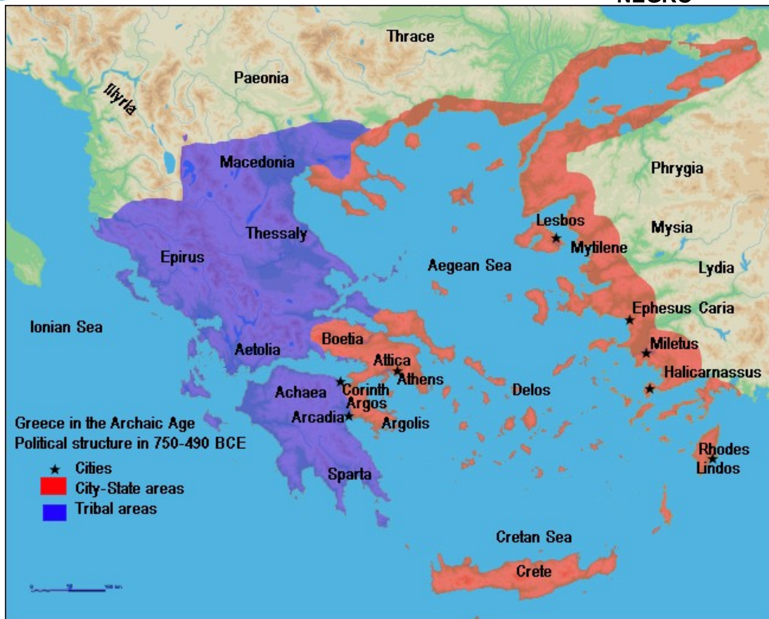
Imagem: Mapa do período arcaico da Grécia / Autor Desconhecido / GNU Free Documentation License.