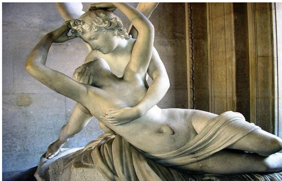
EROS E PSIQUÊ