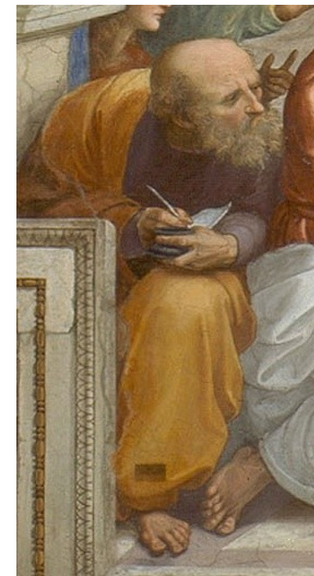
Imagem: Anaximandro, recorte de “Escola de Atenas” / Rafael Sanzio / Public domain.

Atribuem-se-lhe múltiplas investigações e a afirmação de que a Terra é esférica.