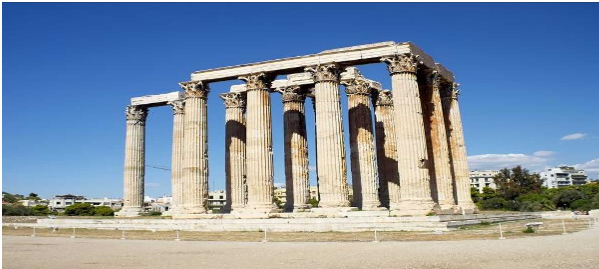
TEMPLO DE ZEUS