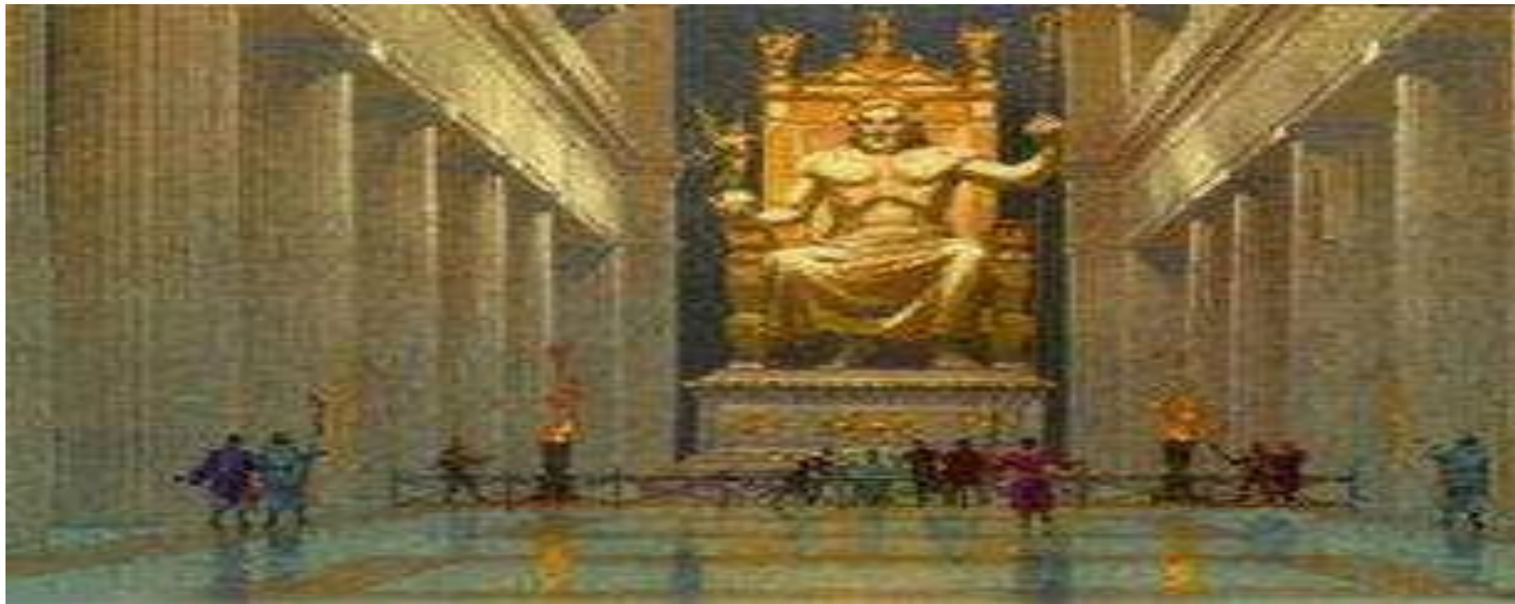
ESTÁTUA DE ZEUS EM SEU TEMPLO