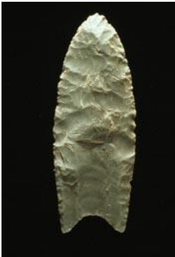
Imagem: Ponta de Clovis / Government of the Commonwealth of Virginia, USA / Warranty of free use of the image for any purpose.

Você ajuda a cortar a carne, e durante algumas horas se sente relaxado, compartilhando a caça com as pessoas a sua volta. Ao pensar sobre o dia, você se sente agradecido por ter conseguido comida, as caçadas tem se tornado cada vez mais difíceis e os animais grandes, mais raros.