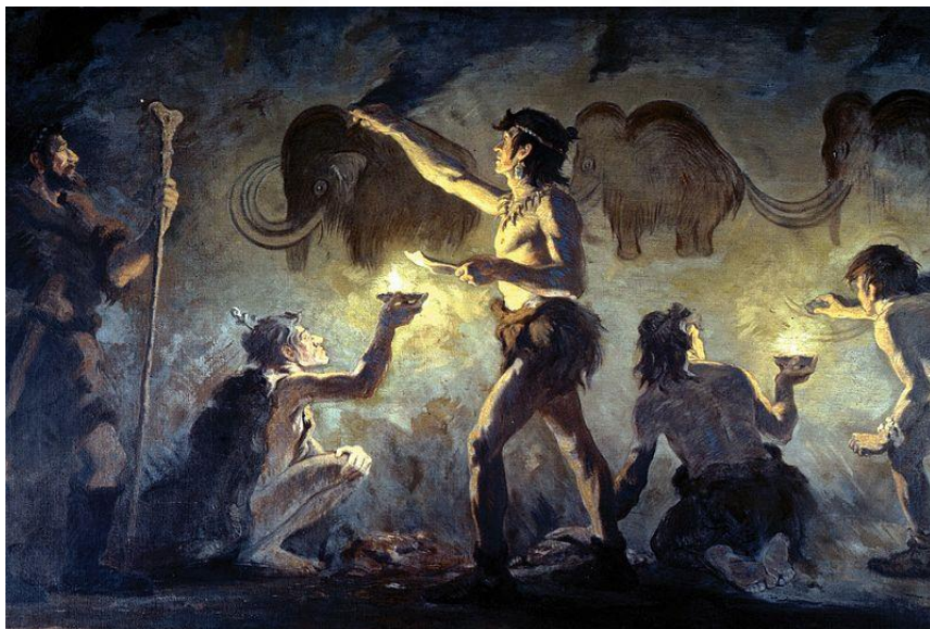
Imagem: Homens de Cro-Magnon pintando na caverna de Font-de-Gaume / Charles R. Knight, 1920 / Public Domain.

O avanço tecnológico propiciado pela criação manual de ferramentas tornaram as caçadas mais bem sucedidas, proporcionando aos hominídeos uma alimentação mais rica em proteínas e nutrientes, o que auxiliou a evolução da estrutura cerebral ao aumentar o tamanho e a capacidade do cérebro.