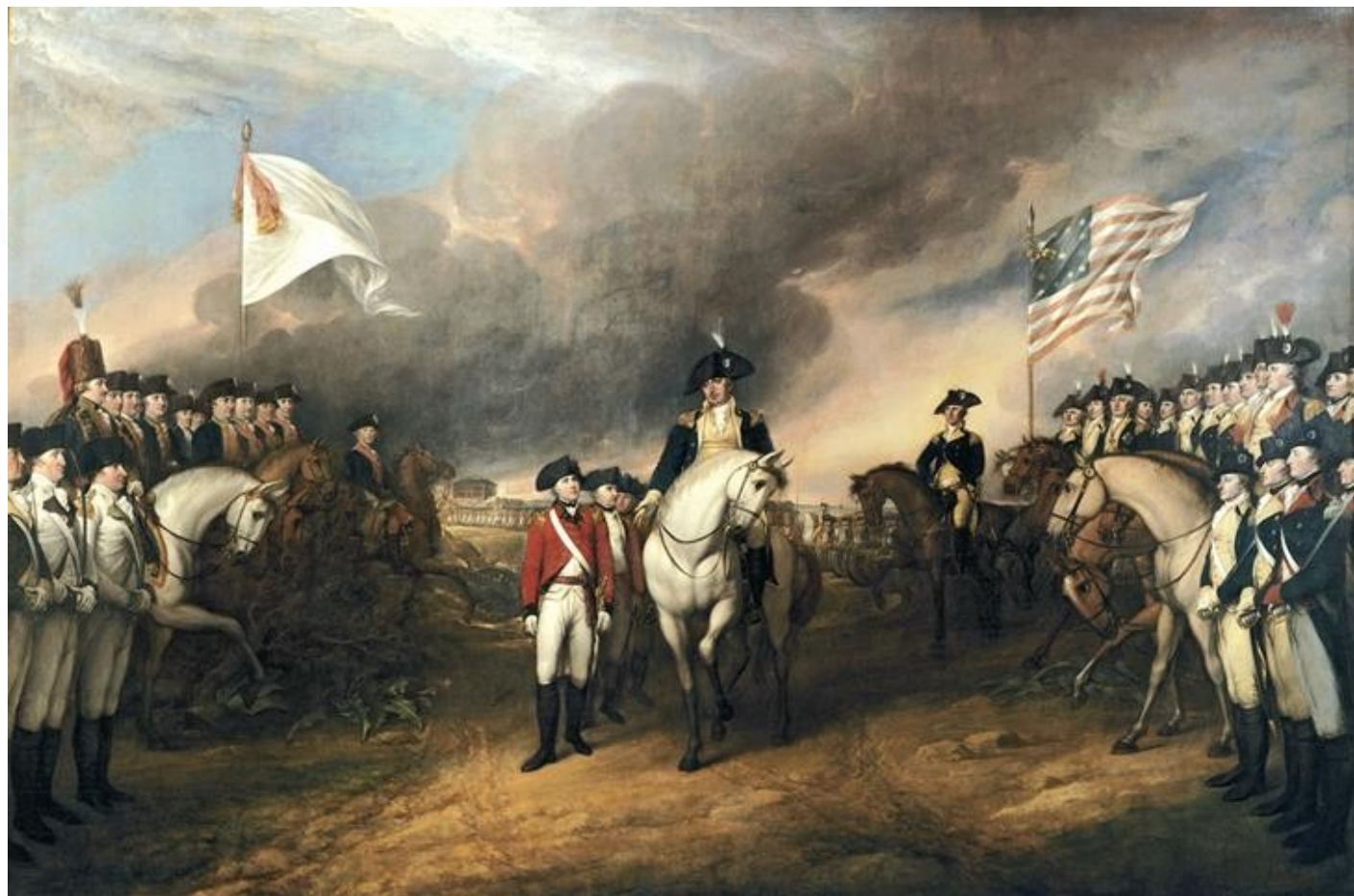
A rendição do competente general britânico Cornwallis em Yorktown, de John Trumbull, 1797.