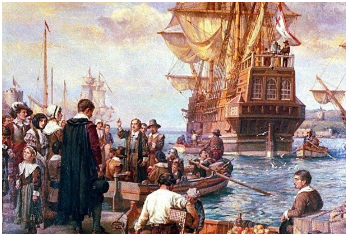
MAYFLOWER: PROTESTANTES PURITANOS