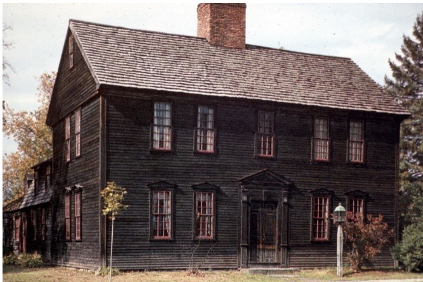
Exemplo de uma casa típica das colônias do centro da costa leste americana