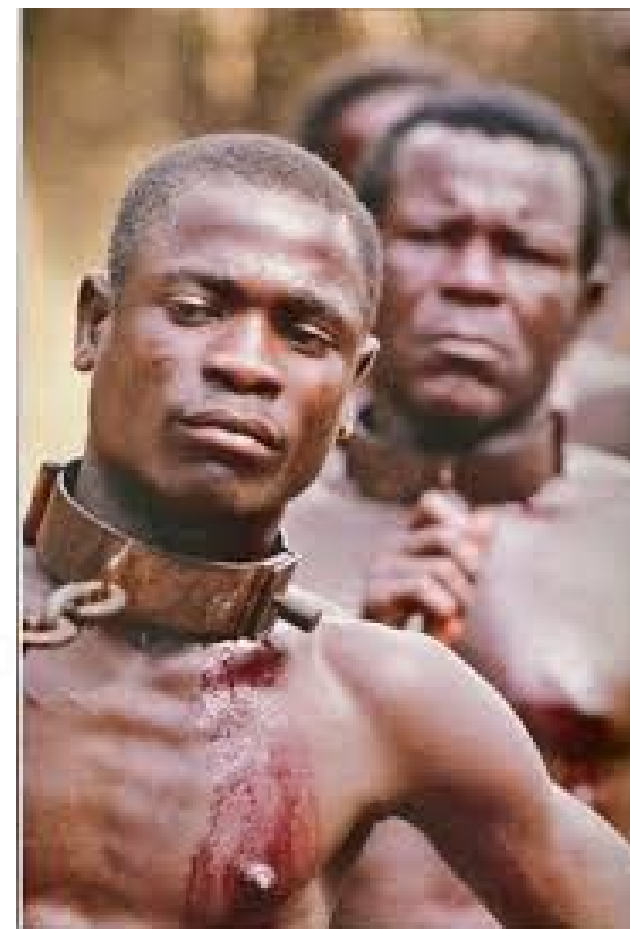
ESCRavidÃO DE NEGROS AFRICANOS