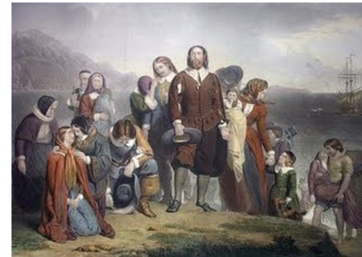
Os peregrinos que chegaram no barco "Mayflower" formam parte da colonização da Nova Inglaterra