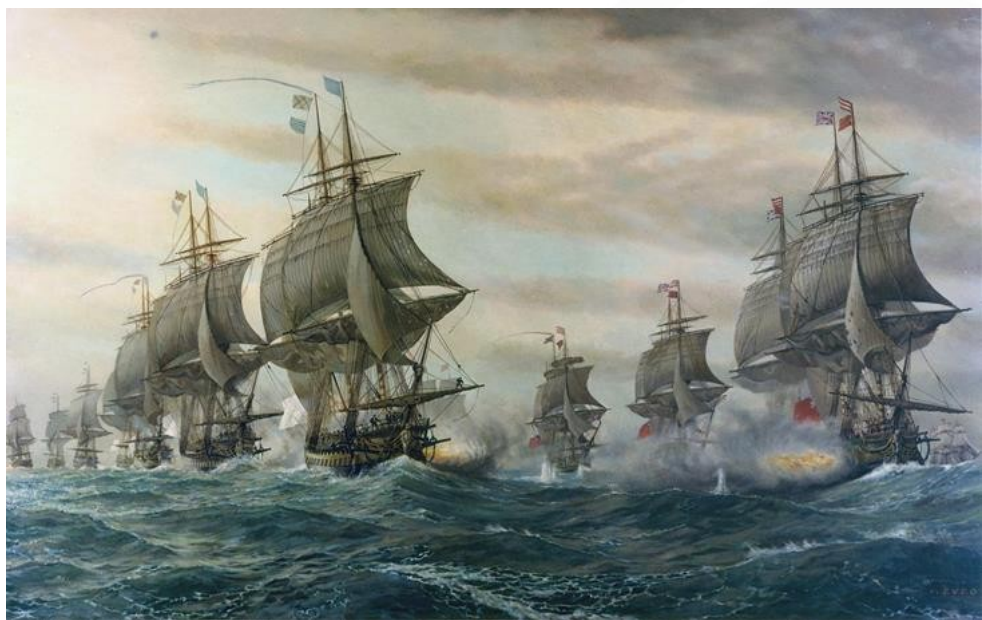
Navios britânicos (direita) e franceses (esquerda) em batalha naval em Chesapeake. V. Zveg.