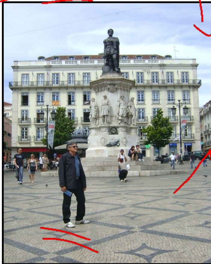
MITO MONUMENTO A CAMÕES (LISBOA)

“Ouçam a longa história de meus males. E curem sua dor com minha dor; Que grandes mágoas podem curar mágoas.”