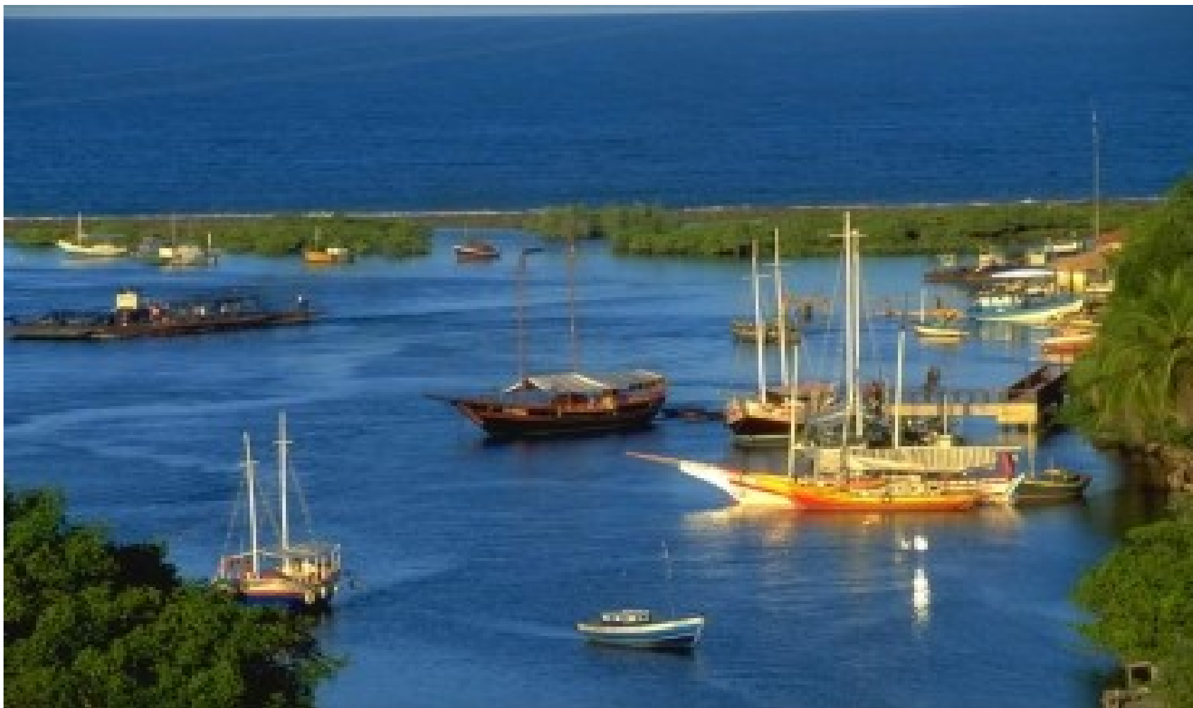
COSTA DO DESCOBRIMENTO - BAHIA E ESPIRITO SANTO