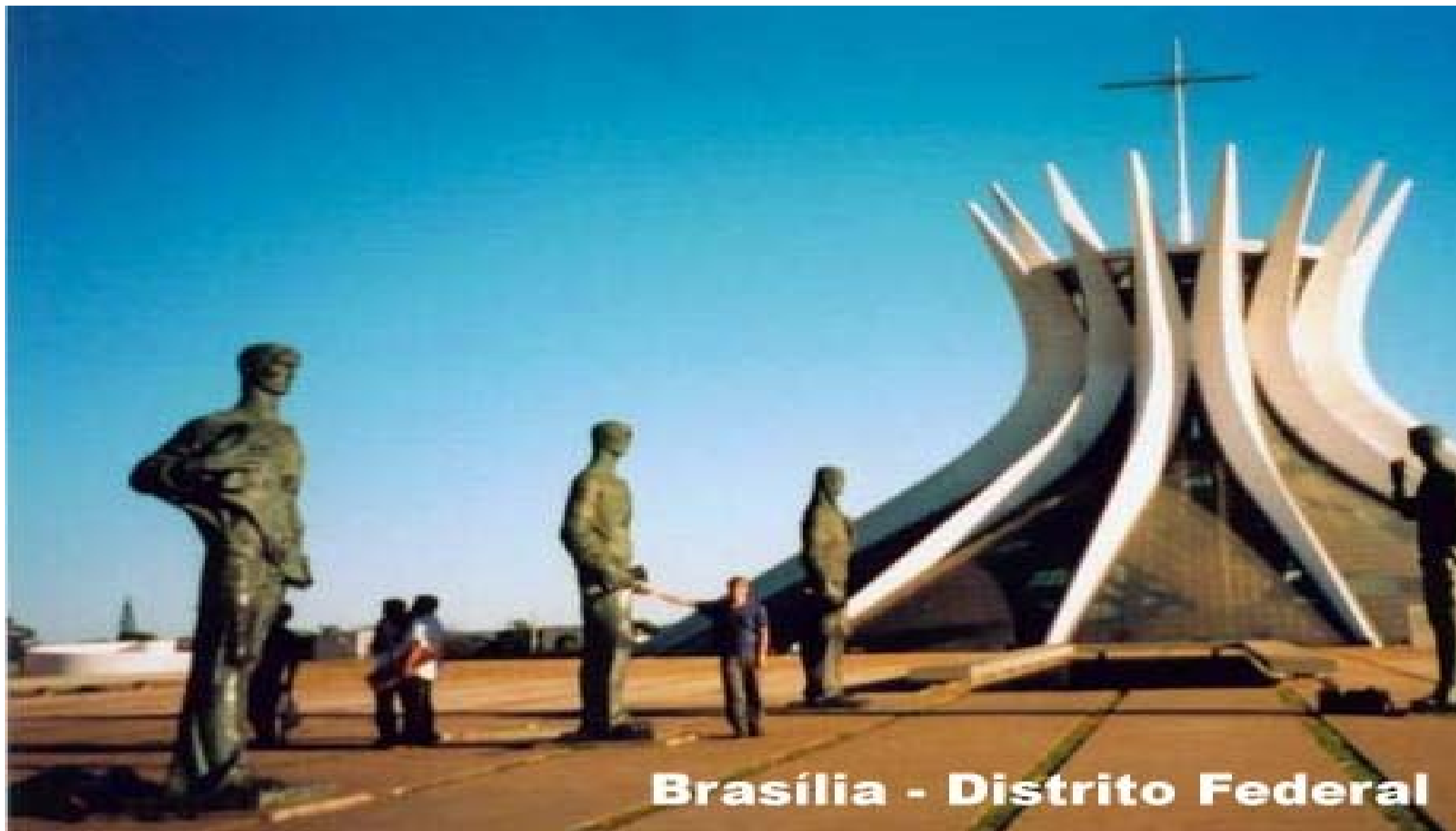
Brasília - Distrito Federal