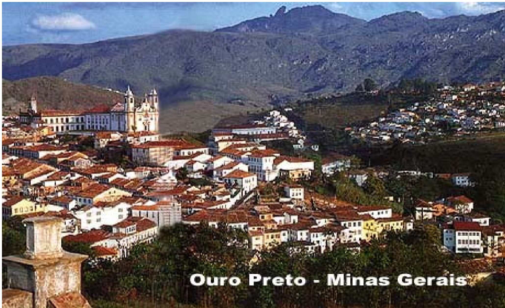
Ouro Preto - Minas Gerais