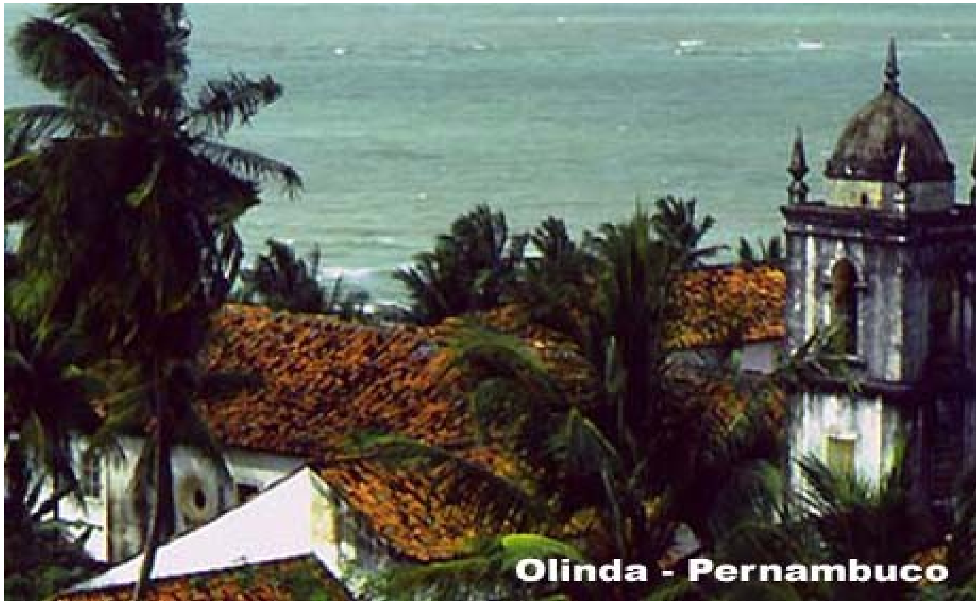
Olinda - Pernambuco