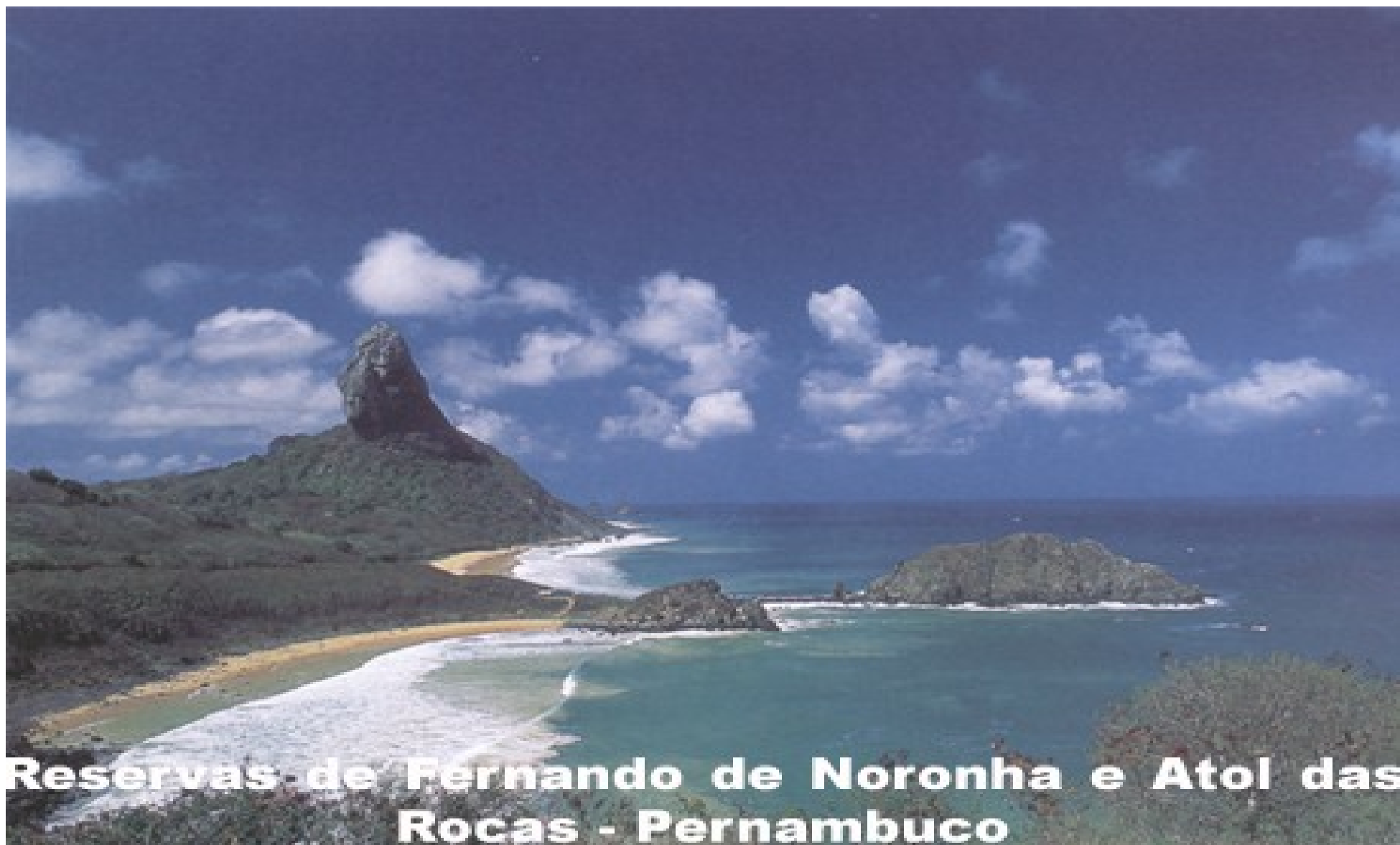
Reservas de Fernando de Noronha e Atol das Rocas - Pernambuco