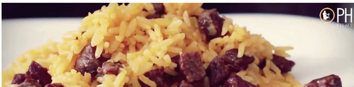
DANÇAS E COMIDAS TÍPICAS | PIAUÍ