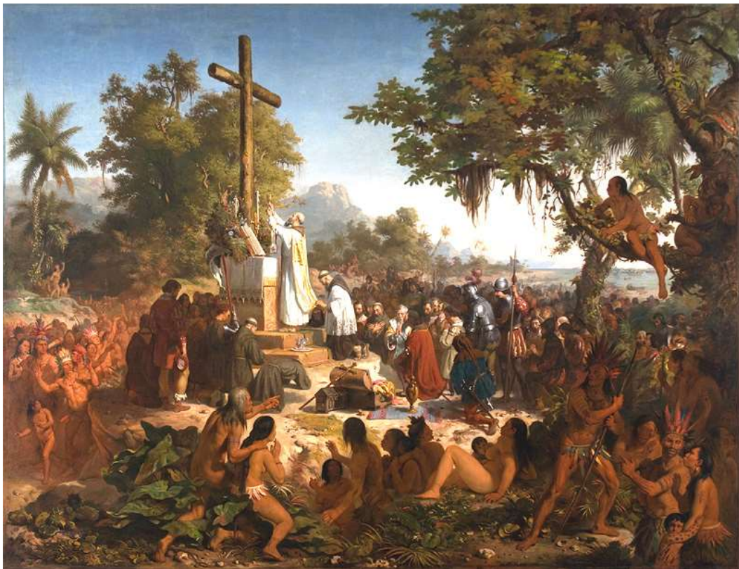
A Primeira Missa no Brasil, quadro de Victor Meirelles.