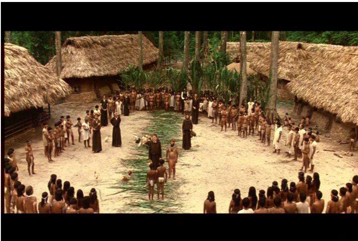
Filme “A Missão”(1986): com Robert De Niro e Jeremy Irons