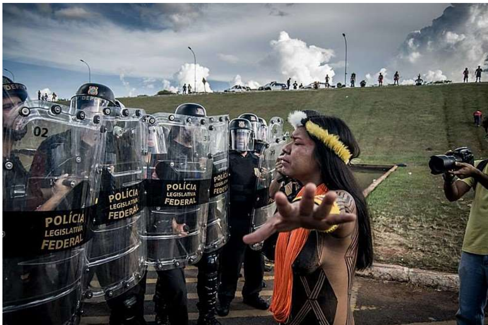
Indígenas em Brasília pedem demarcação de terras