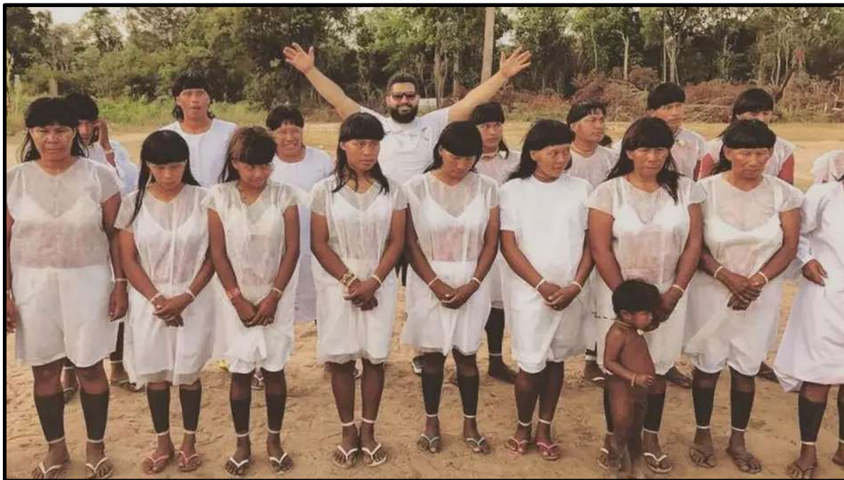
Imagem Reacende Debate Histórico sobre Índios e Cristianismo