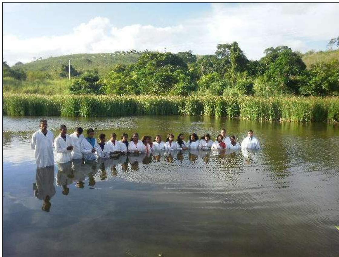
Batismo na Aldeia Indígena Caramuru