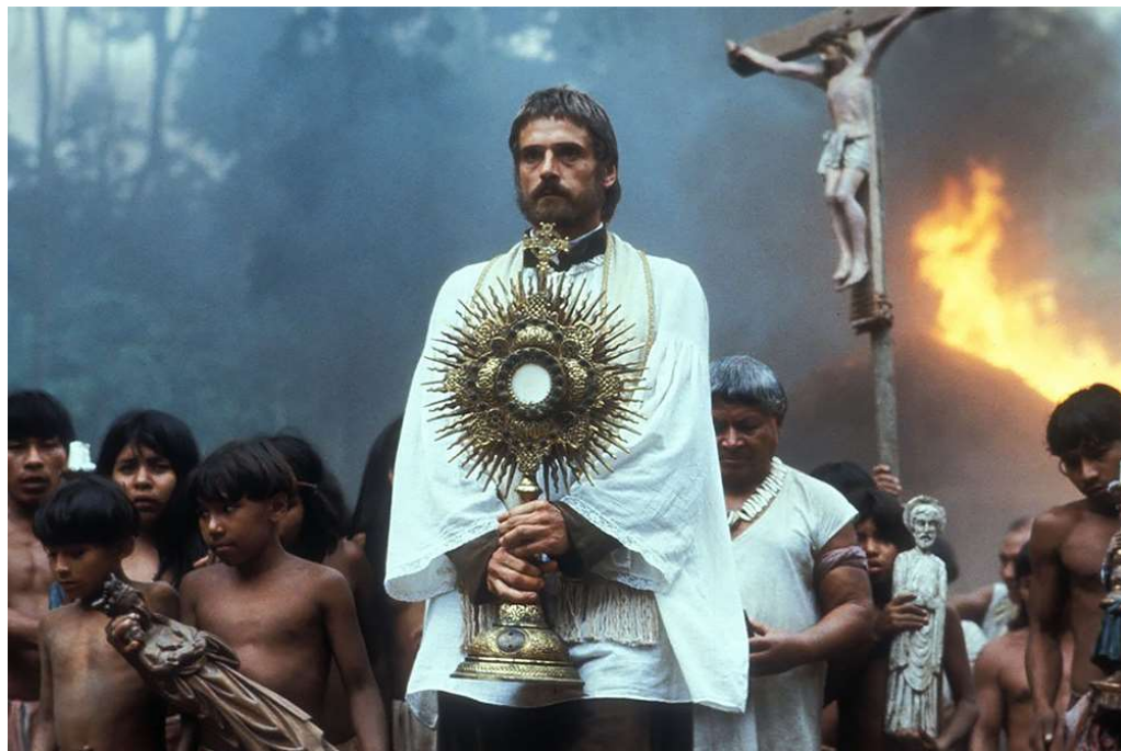
Filme “A Missão”(1986): com Robert De Niro e Jeremy Irons