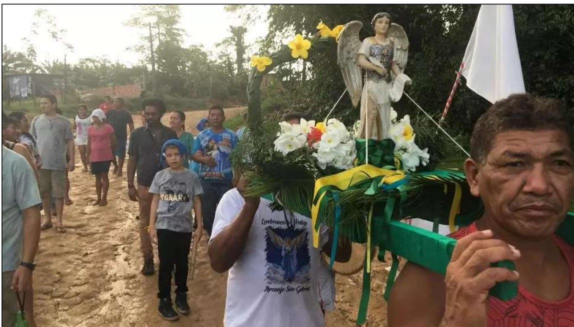
Procissão católica no Parque das Tribos, na periferia de Manaus