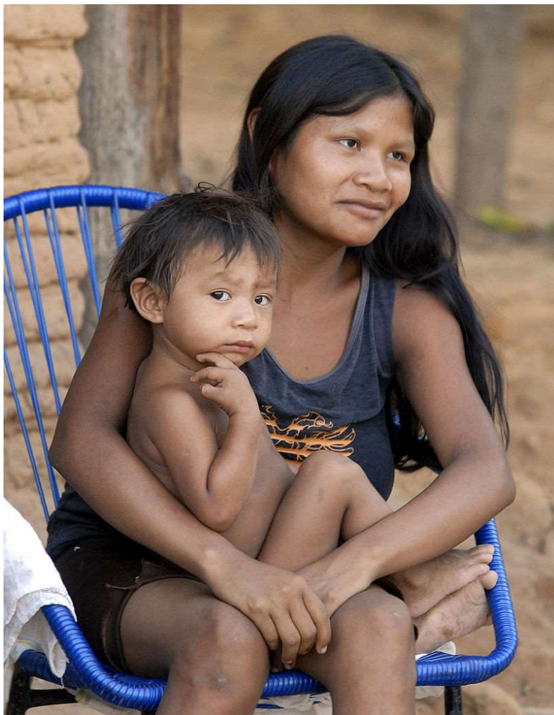
Mãe guajajara com seu filho