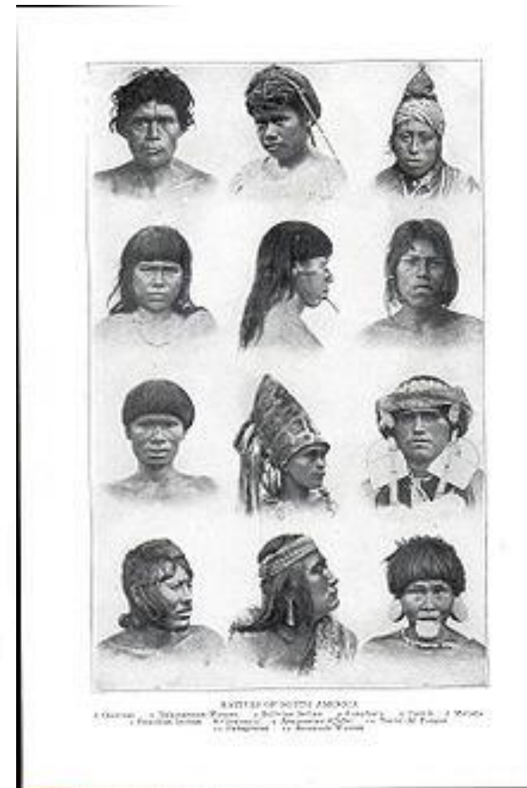
Nativos da América do Sul.