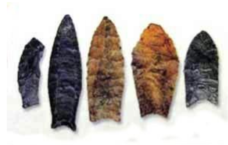
Vestígios da Cultura Clóvis

É uma cultura pré-histórica da América que surgiu há cerca de 13 500-13 000 anos , no final da última Idade do Gelo. Chama-se assim por causa dos artefatos encontrados perto da cidade de Clovis (Novo México) . O povo de Clóvis era considerado o mais antigo habitante do Novo Mundo.