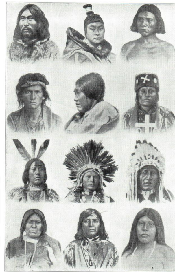
NATIVES OF NORTH AMERICA 1 Eskimo of Labrador 2 Eskimo Woman of Greenland 3 Apache 4 Navaho 5 Koskimo Woman, Vancouver 6 Cheyenne 7 Mandan 8 Ute 9 Blackfoot 10 Woman Moki Chief 11 Nez Perce 12 Wichita Woman

Exemplos de povos pré-colombianos são os olmecas, incas, astecas, maias, guaranis, tupinambás, tupis, apaches, shawees, navajos, inuítes e muitos outros.