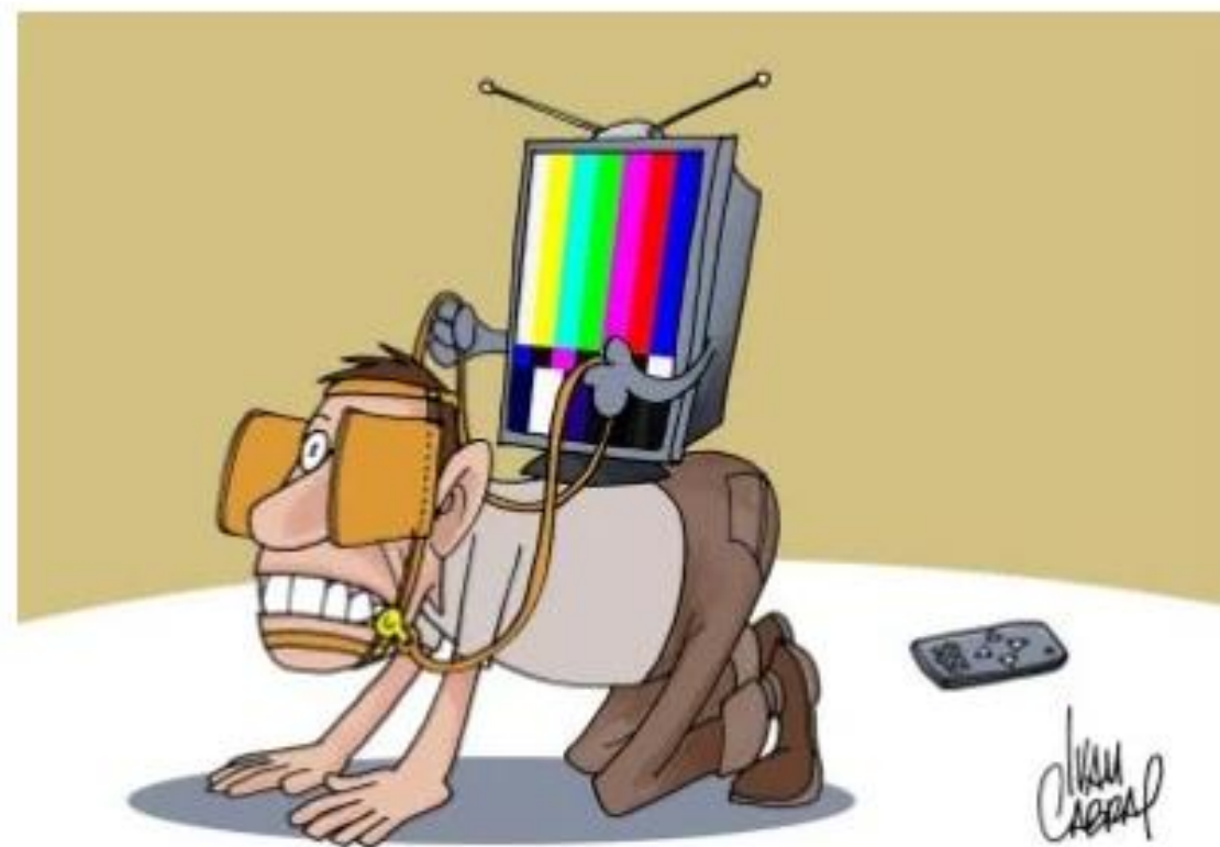
A TV como cabresto

A mídia é um dos grandes exemplos de controle social não formal da atualidade. Ela exerce o controle social através das indicações de comportamento, conselhos e modelos de atitudes a serem seguidos, a custos de exclusão social para quem não partilha dos comportamentos divulgados como padrão.