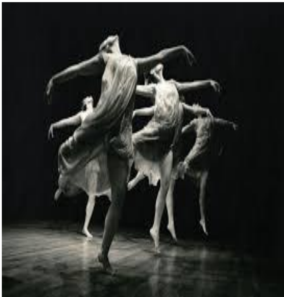
Dança moderna.