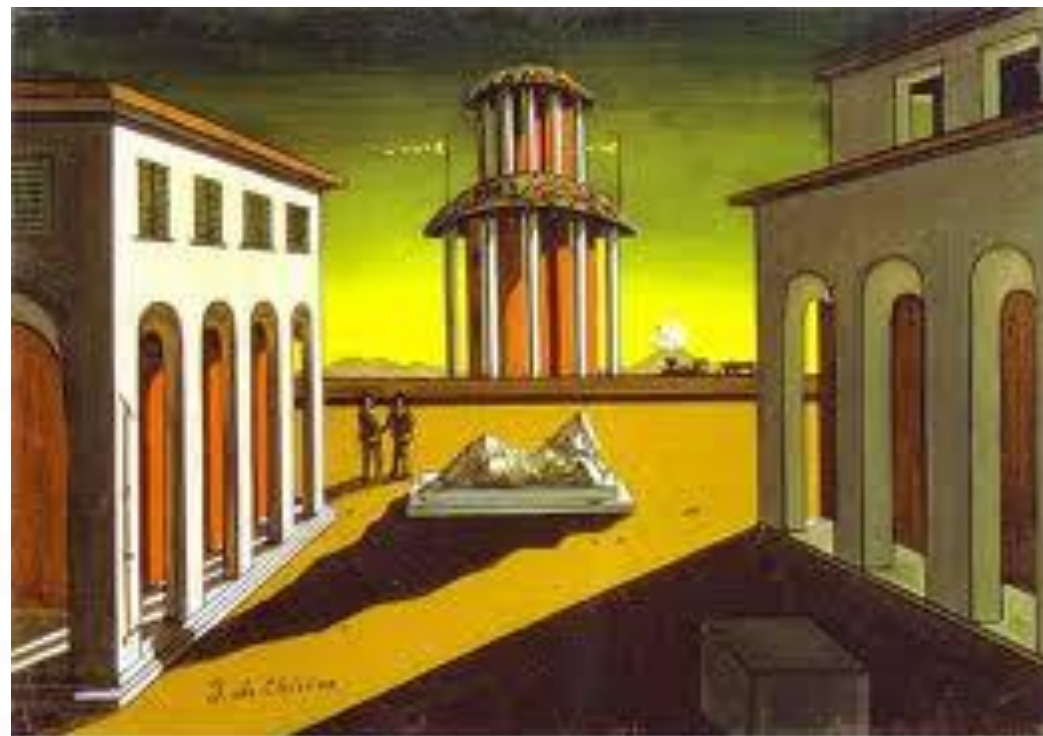
Giorgio de Chirico - Piazza d'Italia

Suas origens devem ser buscadas no dadaísmo e na pintura metafísica de Giorgio De Chirico.