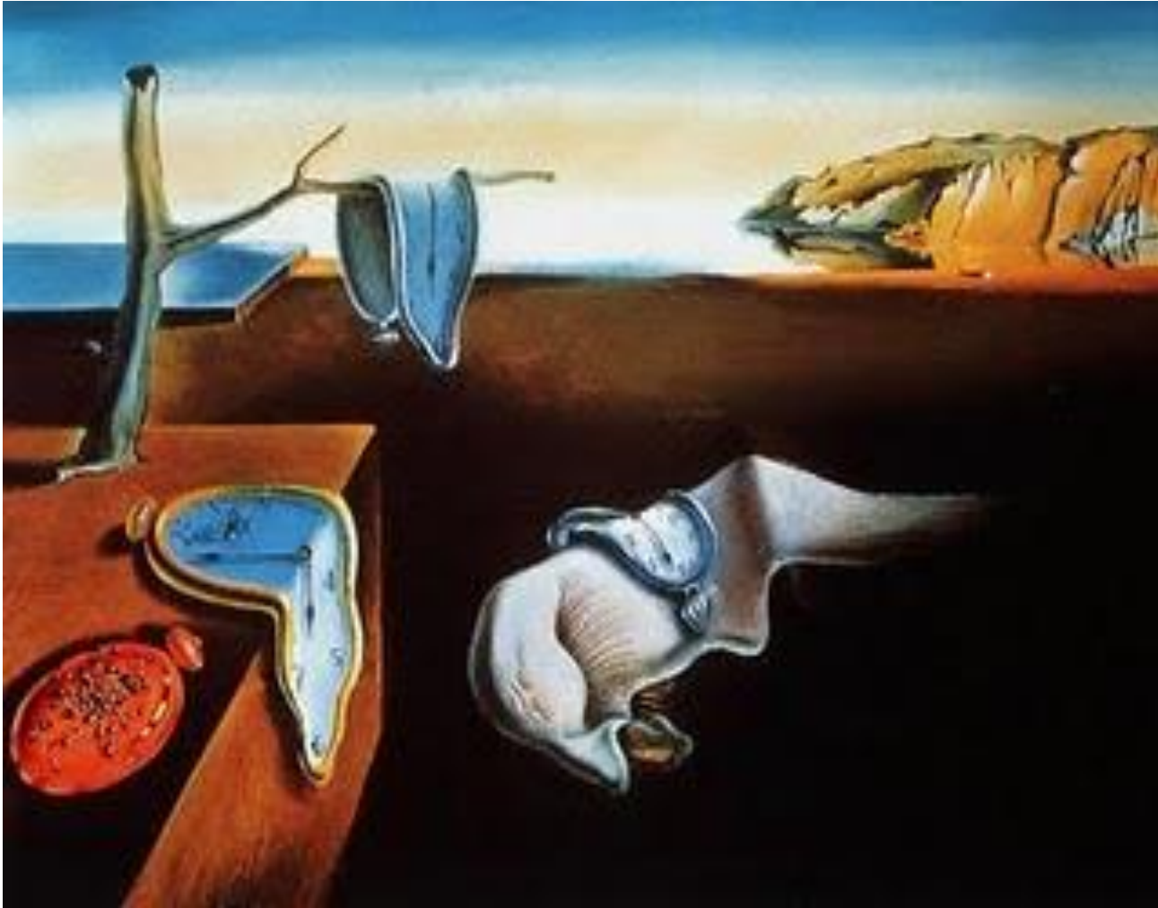
Imagem: Salvador Dalí / Persistência da Memória / 1931 / The Museum of Modern Arts, New York, NY, USA / http://www.wikipaintings.org/en/salvador-dali/the-persistence-of-memory-1931

Este movimento artístico surge todas as vezes que a imaginação se manifesta livremente, sem o freio do espírito crítico, o que vale é o impulso psíquico.