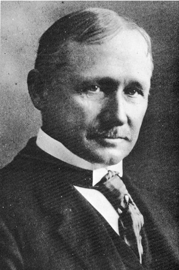
Frederick Taylor 1856-1915