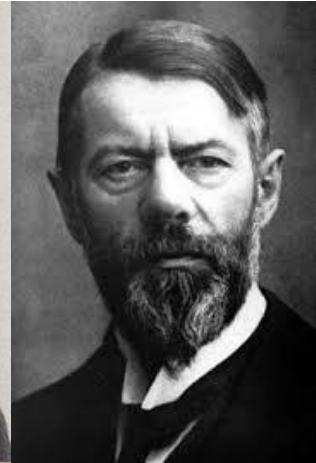
Max Weber 1864-1920