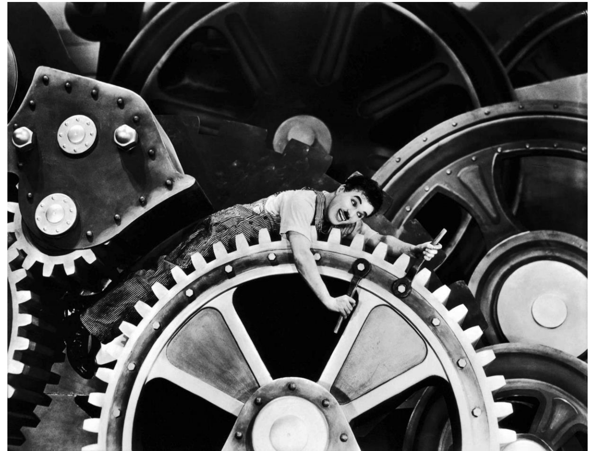
Cena do Filme Tempos modernos com Charles Chaplin