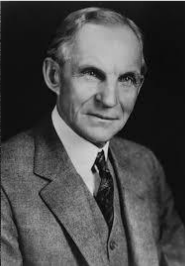
Henry Ford 1863 -1945