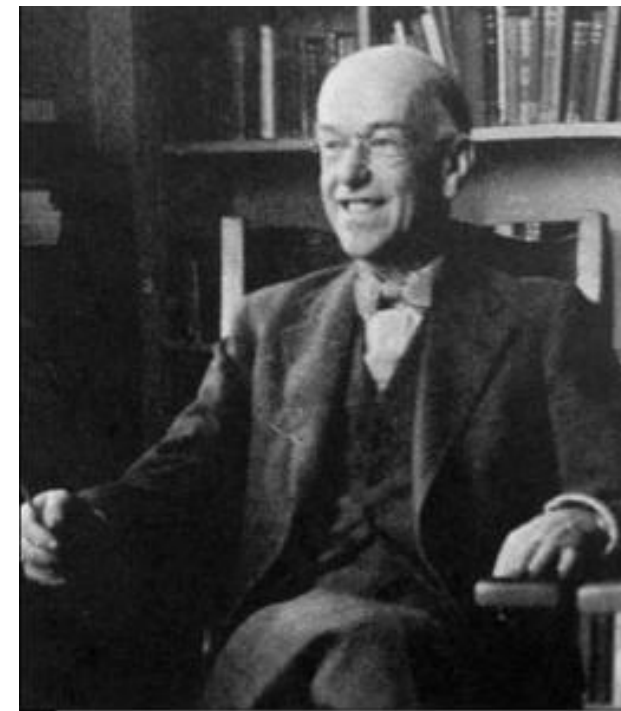
Elton Mayo 1880 - 1849