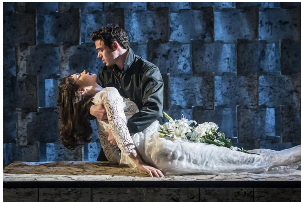
Romeo and Juliet, London Theatre, Shakespeare.