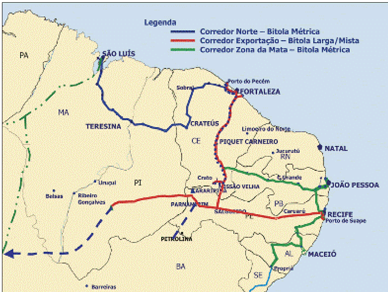
Mapa ferroviária transnordestina